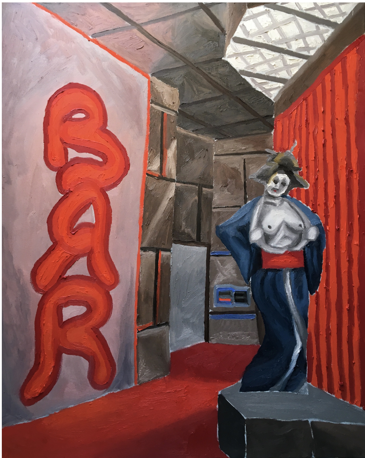
Gejša, 70x100cm, olej na plátně, 2020