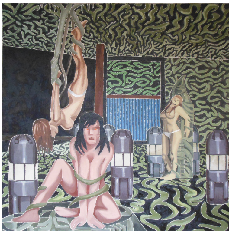
Alien shibari, 170x170cm, olej na plátně, 2020