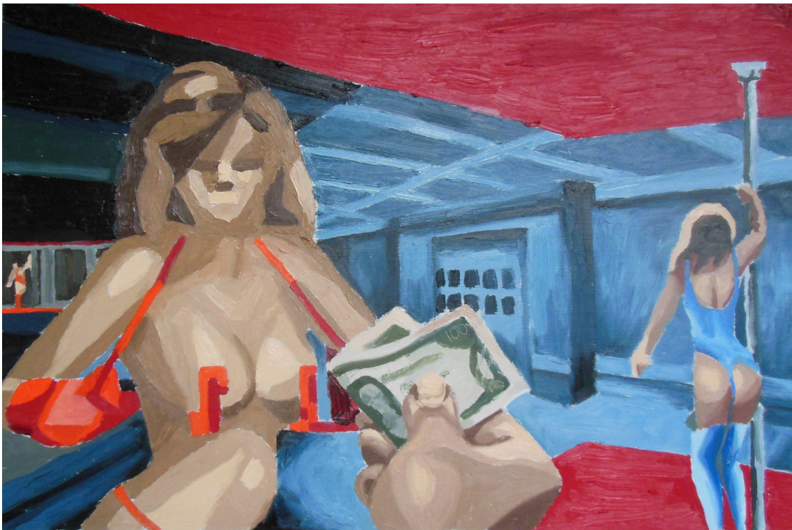
Shake it, baby!, 40x60cm, olej na plátně, 2020