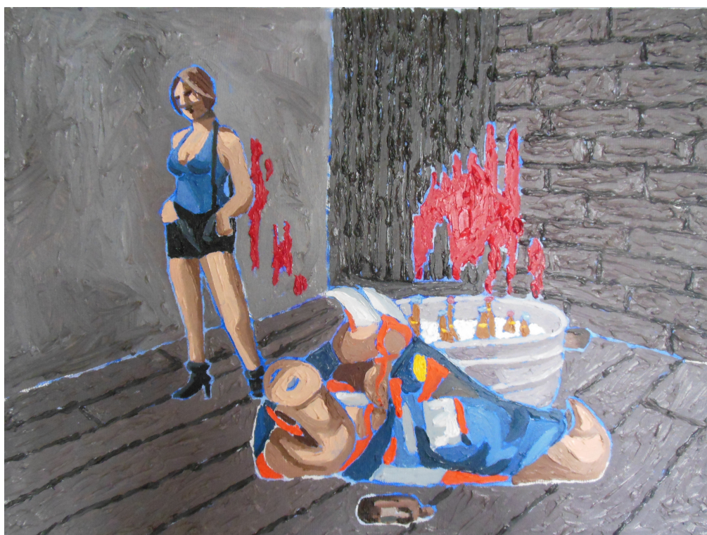
A.C.A.B., 30x40cm, olej na plátně, 2020