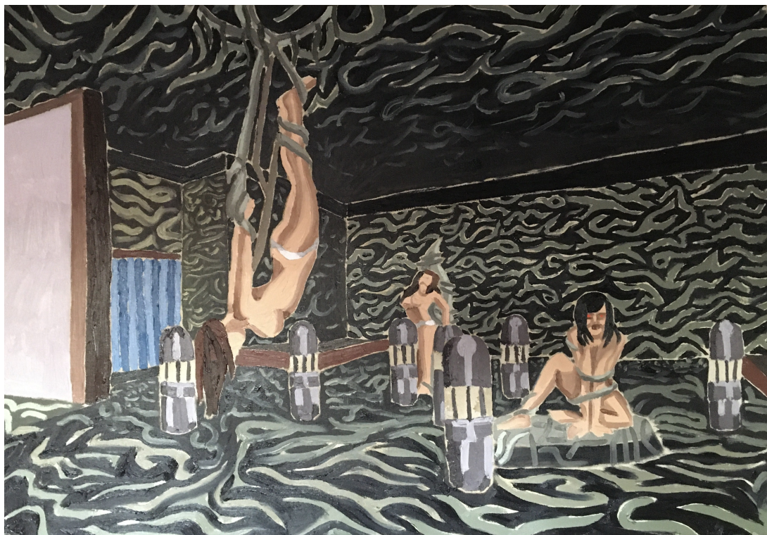
Alien shibari, 100x70cm, olej na plátně, 2020