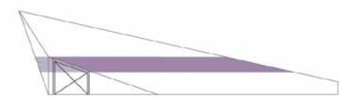
pôdorys 2.np 1:200