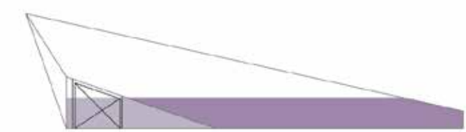
pôdorys 1.np 1:200