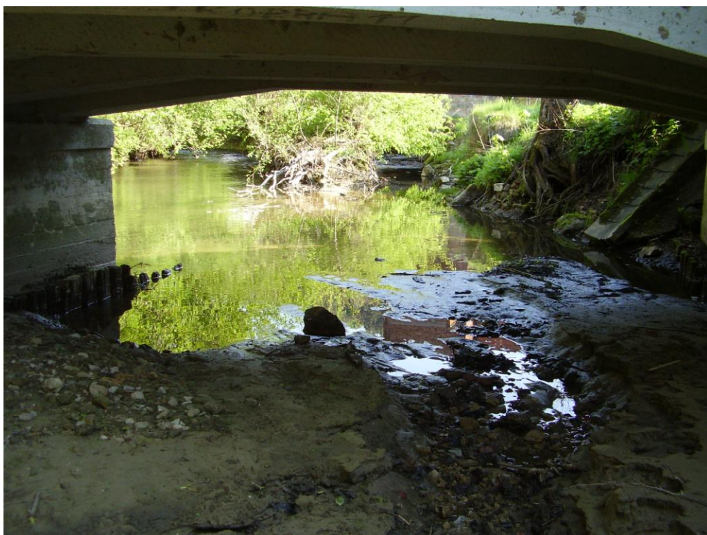
Foto č. 10 – Pohled mostním polem nad bývalým náhonem proti proudu, před pilířem provalená hrázka a nové zaústění náhonu. Rok 2011.