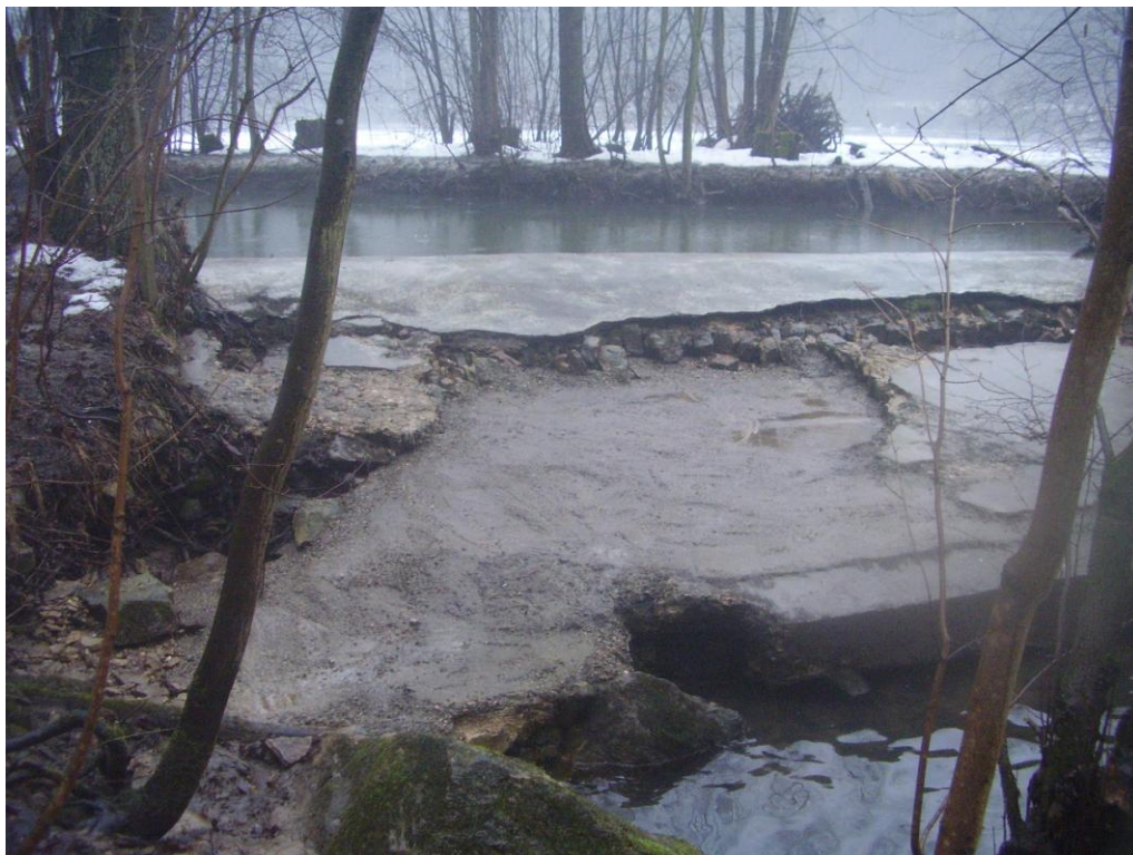
Foto č. 3 – Pravobřežní pole po provizorní sanaci betonem. Rok 2011.