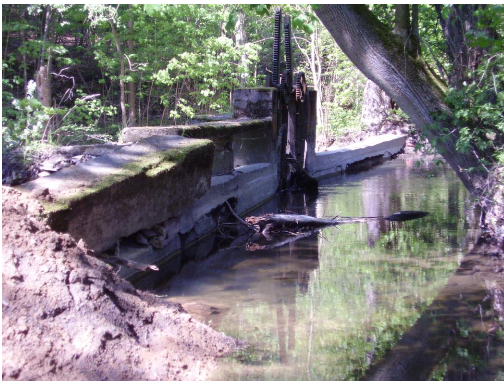
Foto č. 6 – Pohled z náhonu do jezové zdrže, vlevo zasypání průrvy jílovitou zeminou. Rok 2011.