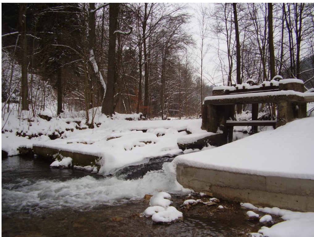
Foto č. 4 – Levobřežní pole již po rekonstrukci, pravobřežní plánováno na rok 2013. Rok 2012.