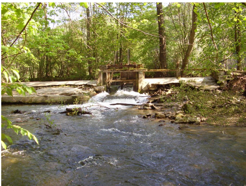
Foto č. 2 – Poškozený kamenný jez v km 3,625, se zasýpanou průrvou vpravo. Rok 2011.