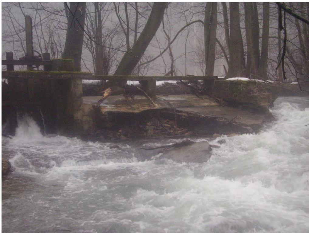
Foto č. 1 – Silně poškozené levobřežní pole jezu s průrvou v břehu a zničené zavázání. Rok 2011.