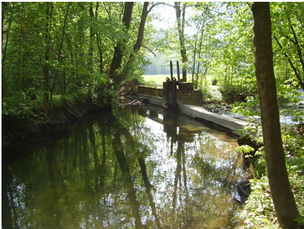
Foto č. 7 – Pohled po směru toku. Vlevo odbočení do náhonu. Rok 2011.