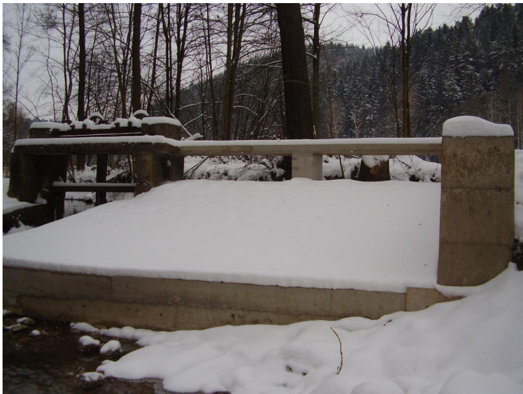
Foto č. 5 – Pravobřežní pole a nábrežní zeď po rekonstrukci. Rok 2012.