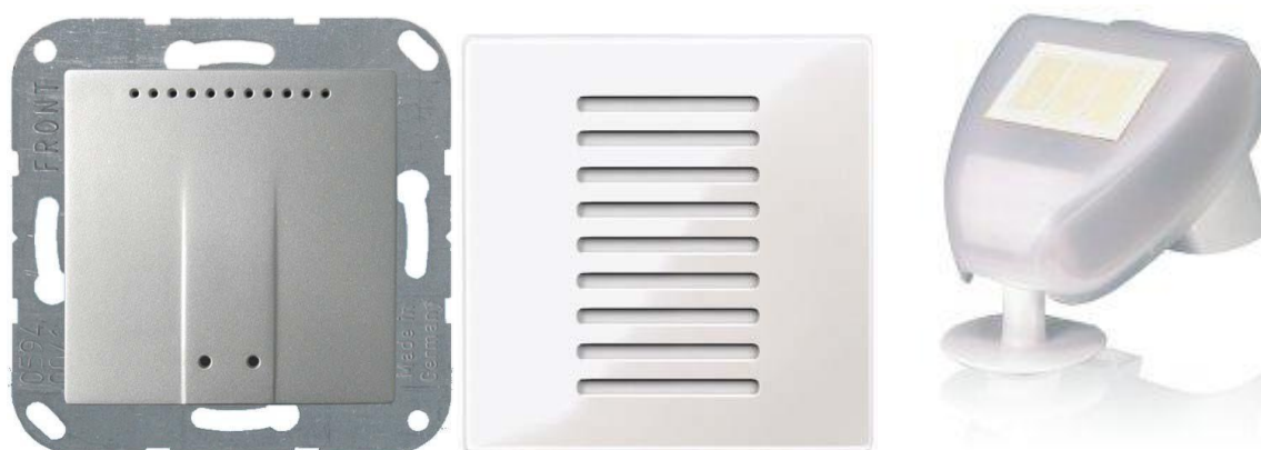
Obrázok 14- Senzor vlhkosti, bez tlačidlový termostat, senzor poveternostných podmienok KNX