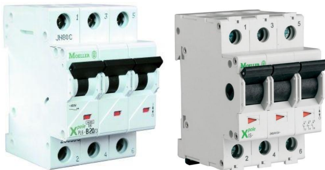
Obrázok 6- Trojpólový (hlavný) istič rady PL6 s menovitým prúdom 20A (50A) a hlavný vypínač rady IS-63/3, od firmy EATON