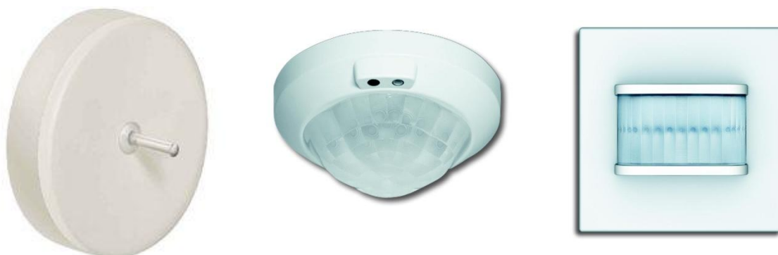
Obrázok 13- Senzor oslnenia, senzor pohybu stropný a senzor pohybu nástenný KNX