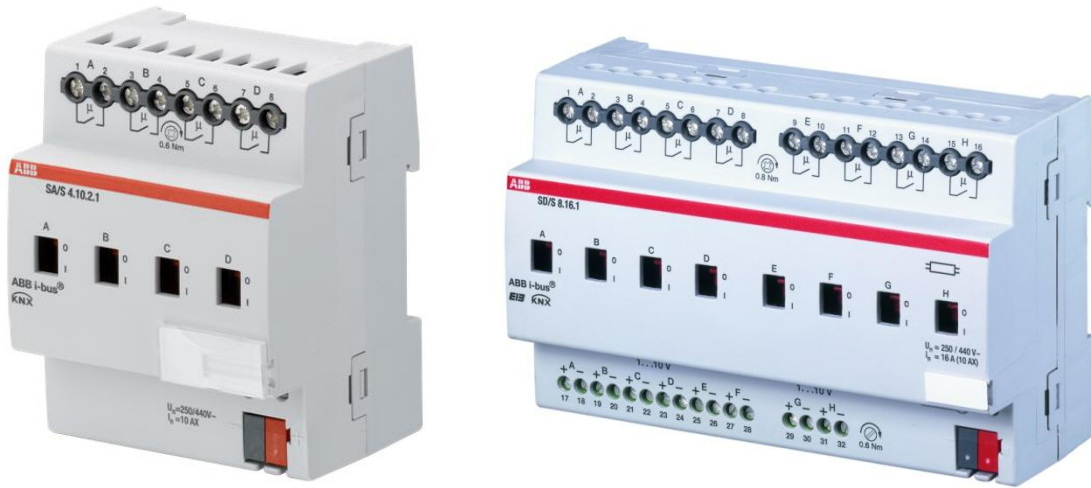
Obrázok 15- Aktor na spínanie svetelného obvodu, aktor na spínanie a stmevanie svetelného obvodu KNX