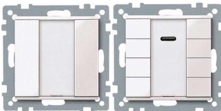
Obrázok 10- Štvortlačidlový spínač s IR a jednotlačidlový spínač KNX