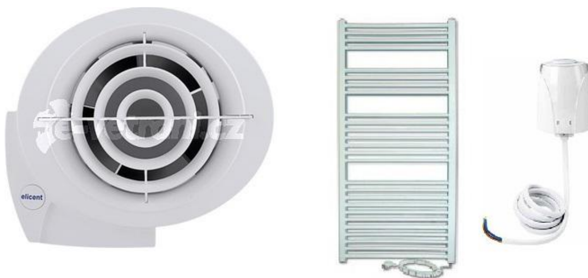
Obrázok 3- Nástenný ventilátor s časovým dobehom, výhrevný elektrický rebřík, pohon hlavice ventilu TČ (termopohon)