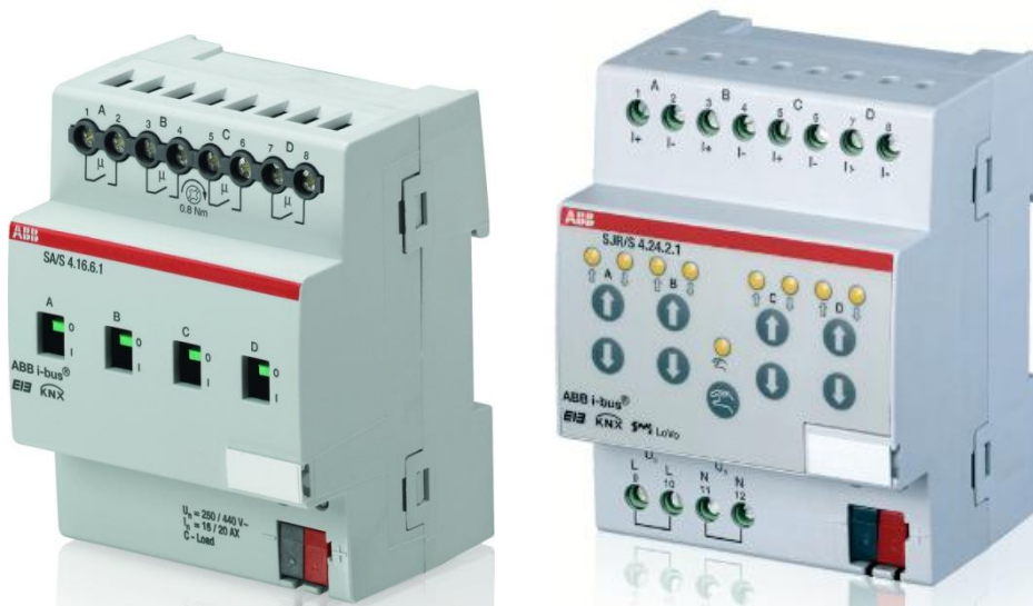
Obrázok 16- Spínací aktor zásuvkových vývodov, spínací aktor žalúzií KNX