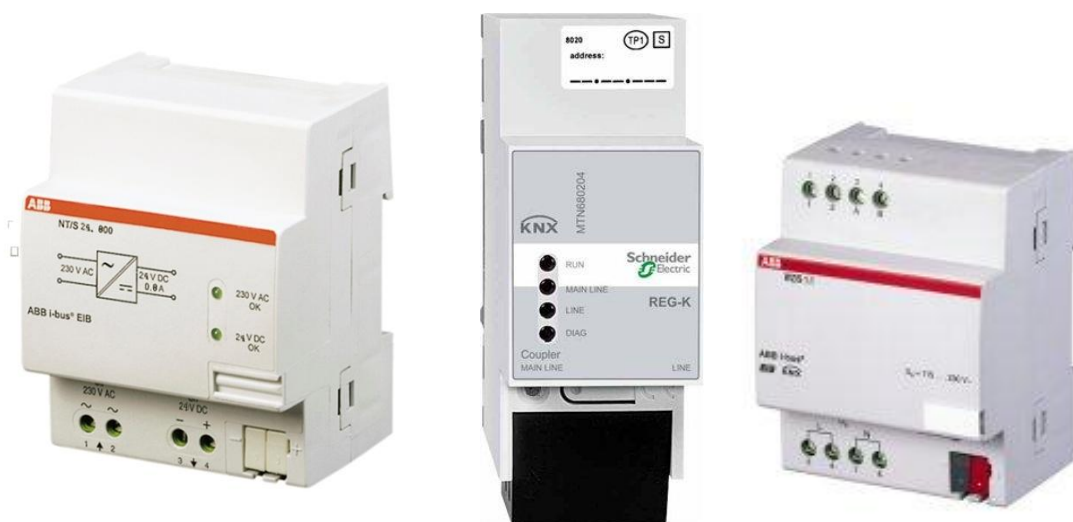
Obrázok 17- Napätový zdroj, líniová spojka, poveternostný aktor KNX