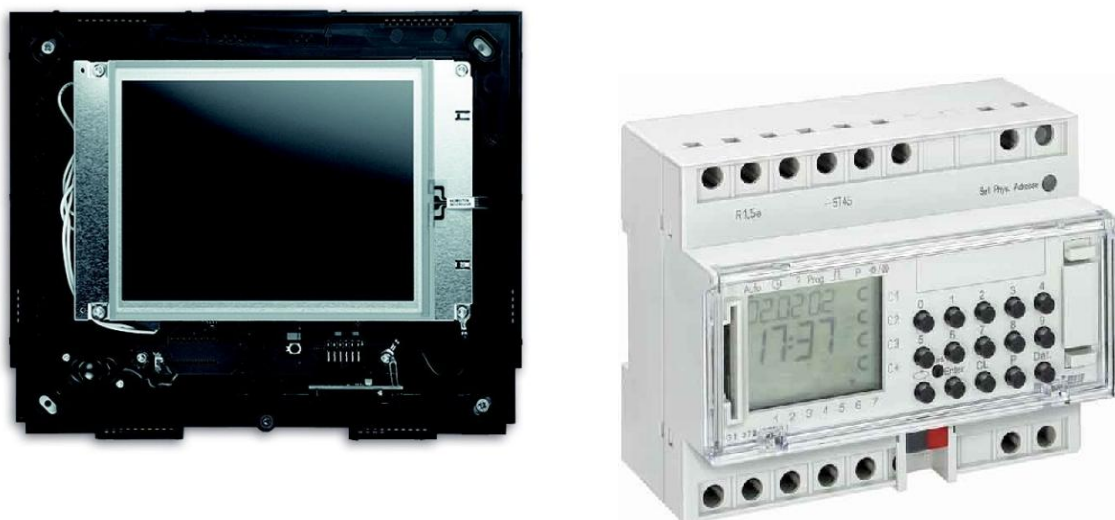
Obrázok 12- Centrálna jednotka a časový spínací aktor KNX