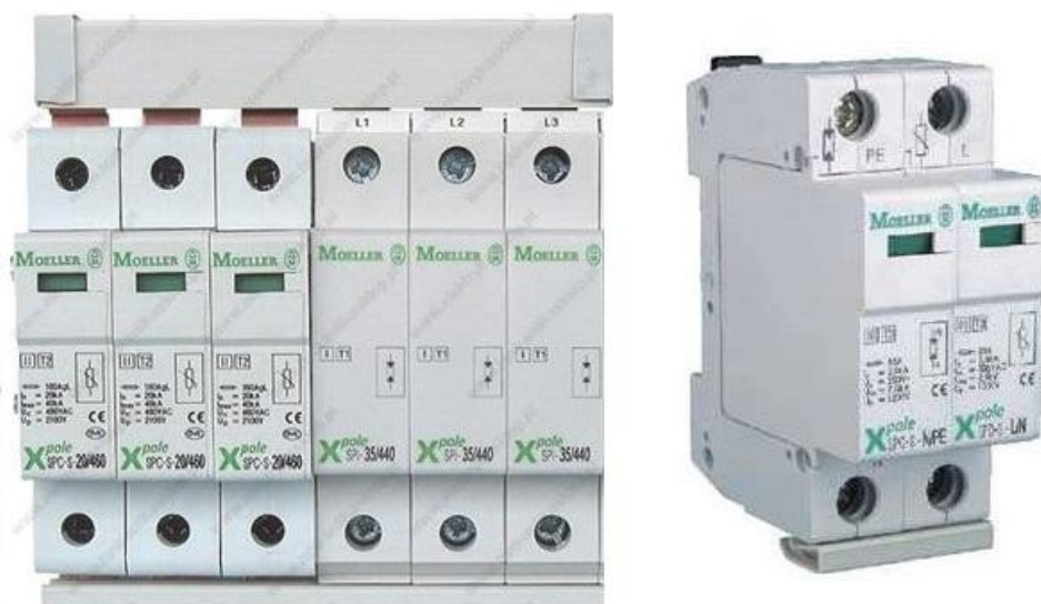
Obrázok 9- Zvodiče prepätia triedy T1, T2, T3 montované v BR, od firmy EATON