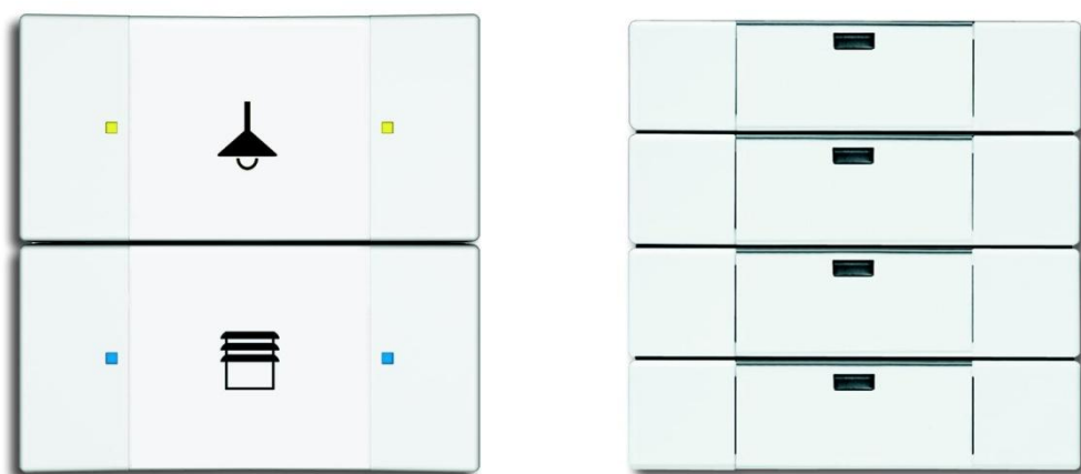
Obrázok 11- Dvojtlačidlový spínač a štvortlačidlový spínač KNX