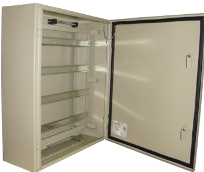
Obrázok 18- Bytová rozvodná skriňa 800x600x200