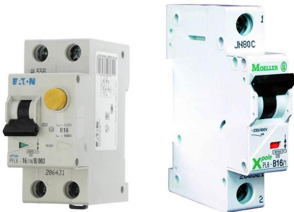
Obrázok 5- Jedno + N pólóv chránič rady PFL6/B s menovitou hodnotou 16A(20A) a reziduálnym prúdom 30mA a Jednopolové ističe rady PL6/B s menovitým prúdom 16A, od firmy EATON