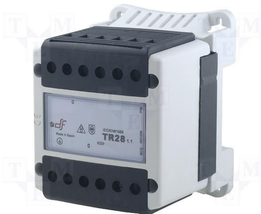
Obrázok 19- Bezpečnostný transformátor 40VA, 230/12V