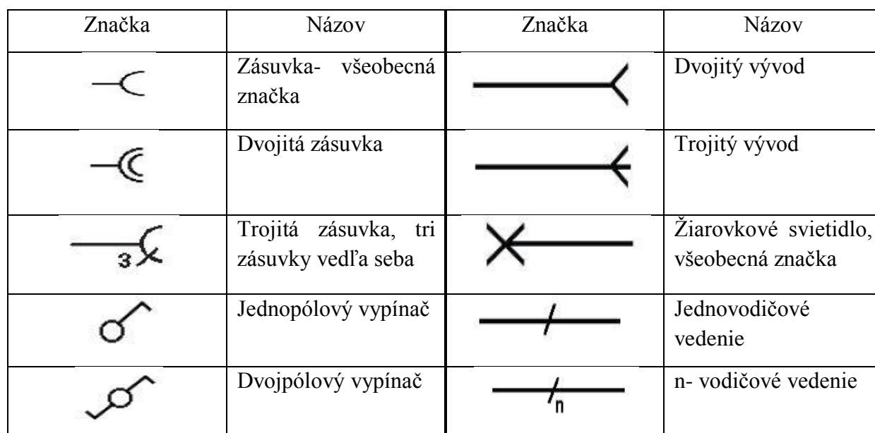
Tabuľka 3- Elektrotechnické značky 4

Prikreslení schém rozvádzačov a rozvodníc sa využívajú takzvané blokové schémy alebo jednopólové, ktoré patria medzi dokumenty vyjadrujúce funkciu, činnosť. [3], [4], [16], [18]