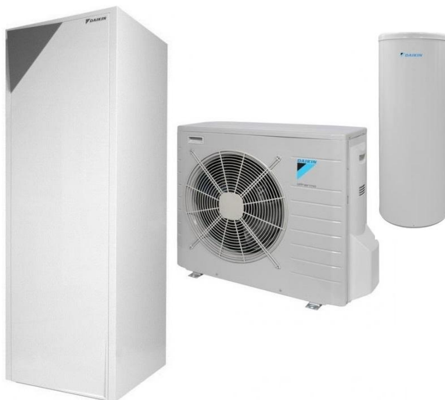
Obrázok 2- Tepelné čerpadlo DAIKIN vnútorná, vonkajšia jednotka a externý zásobník TÚV