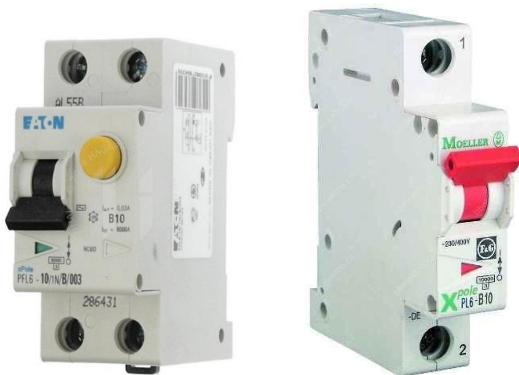
Obrázok 4- Jednopolový istič rady PL6/B s menovitým prúdom 10A a jedno + N pólóv chránič rady PFL6/B s menovitou hodnotou 10A a reziduálnym prúdom 30mA, od firmy EATON