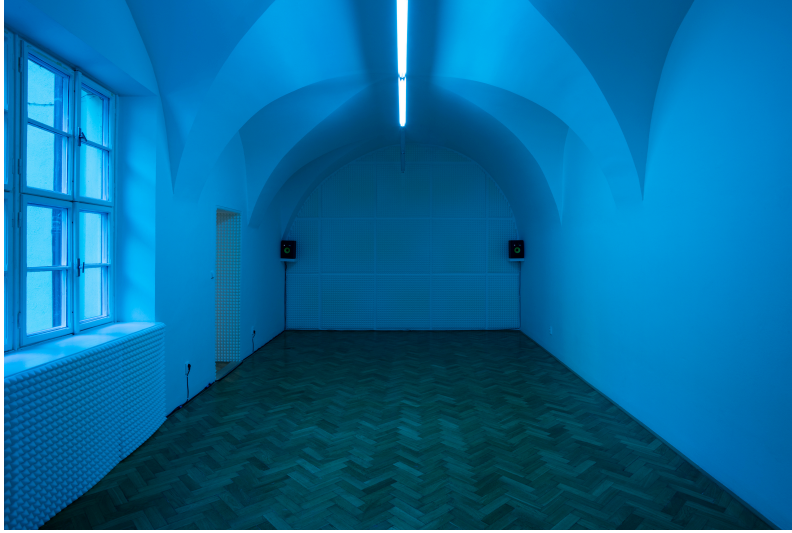
XYZ project - Afterimage