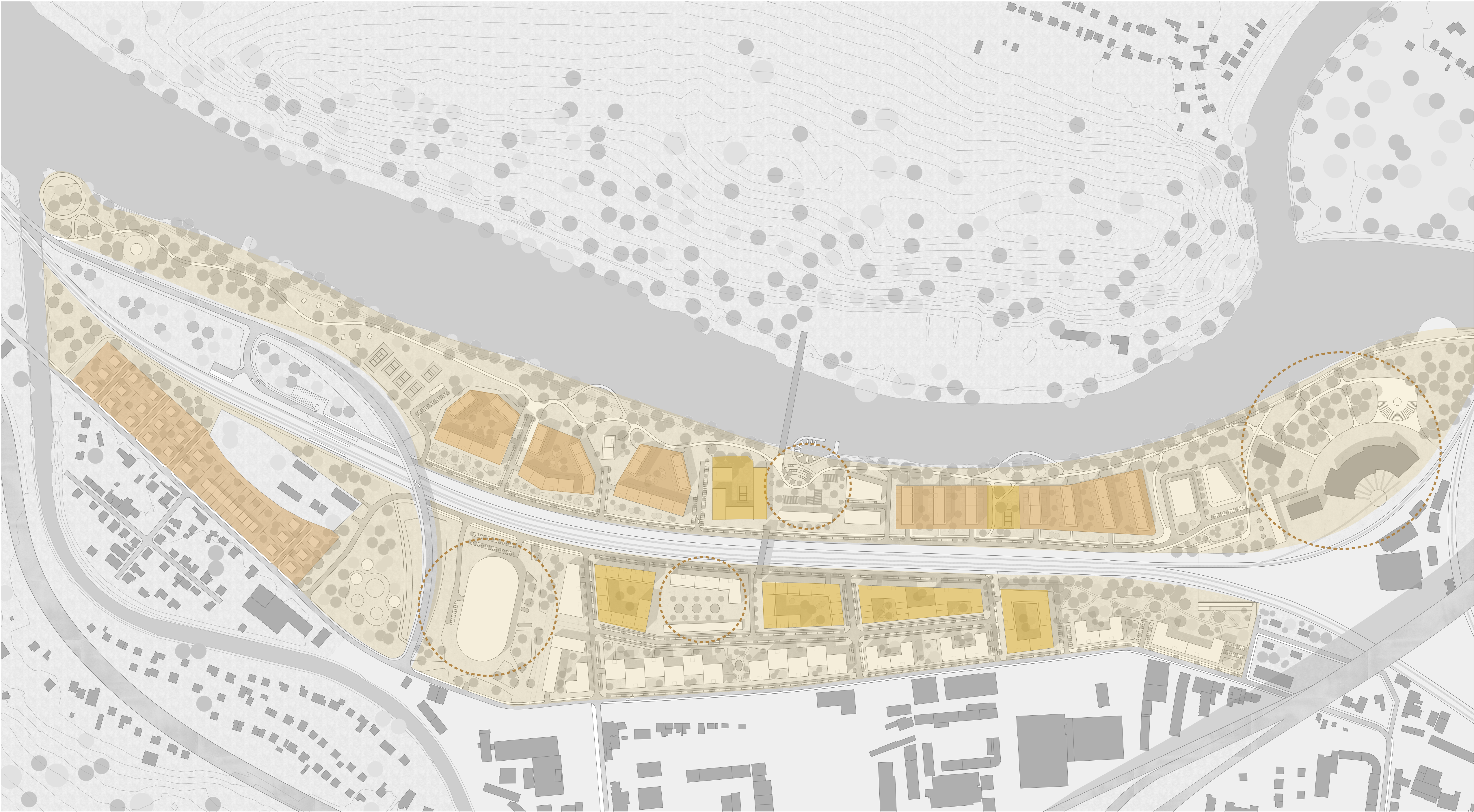
HIERARCHIE PRIESTOROV 1:2500