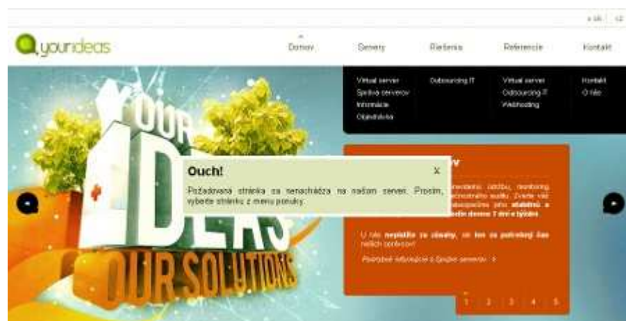
Obr. 4.1: Chybová hláška na stránke

Stará sa o spracovávanie a zobrazovanie stavových kódov protokolu HTTP. Najčastejšie sa možno stretnúť so stavovým kódom 404, ktorý užívateľa informuje o tom, že požadovaný dokument nebol na serveri nájdený. Tento prezentér obsahuje obsluhu stavových kódov a ku konkrétnemu stavovému kódu priraduje šablónu, ktorá sa zobrazí ako reakcia na vzniknutú udalosť, napríklad na nenájdenný súbor. Výhodou je vlastná, prispôbena chybová hláška, ktorá nemusí byť definovaná v .htaccess ako je to zvykom u webových prezentácií.