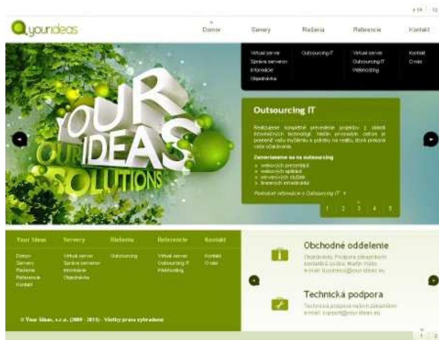
Obr. 4.4: Úvodná stránka

Hneď v úvode je javascript použitý k efektnému prechádzaniu medzi jednotlivými podstránkami bez nutnosti obnovenia celej stránky. Podstránky, možno ich označiť „slajdy“, prezentujú hlavné produkty spoločnosti. K dosiahnutiu výsledného efektu je opäť použitá knižnica jQuery a jej funkcie fadeout() a fadeIn(). Rovnaký efekt je využitý aj v pätičke stránky na prepínanie medzi kontaktmi spoločnosti a informáciami o používaných technológiách.