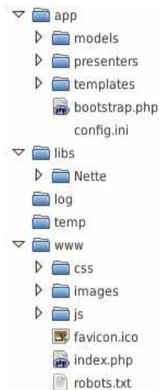
Obr. 2.1: Adresárová štruktúra

Medzi ďalšiu, vyššie nespomenutú výhodu patrí voľnosť vo vytváraní adresárovej štruktúry. Odporúčaná adresárová štruktúra v stabilnej verzii frameworku 0.9.7b je nasledovná: (9)