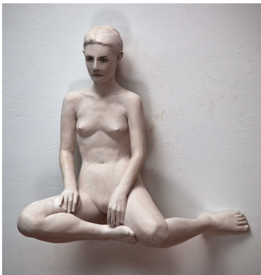
KATEŘINA , ACRYSTAL, FOTOGRAFICKÁ EMULZE, 84 X 88 X 52 CM, 2012.