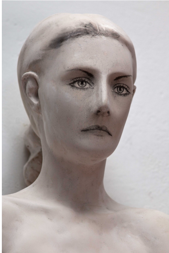
KATEŘINA (DETAIL), ACRYSTAL, FOTOGRAFICKÁ EMULZE, 84 X 88 X 52 CM, 2012.