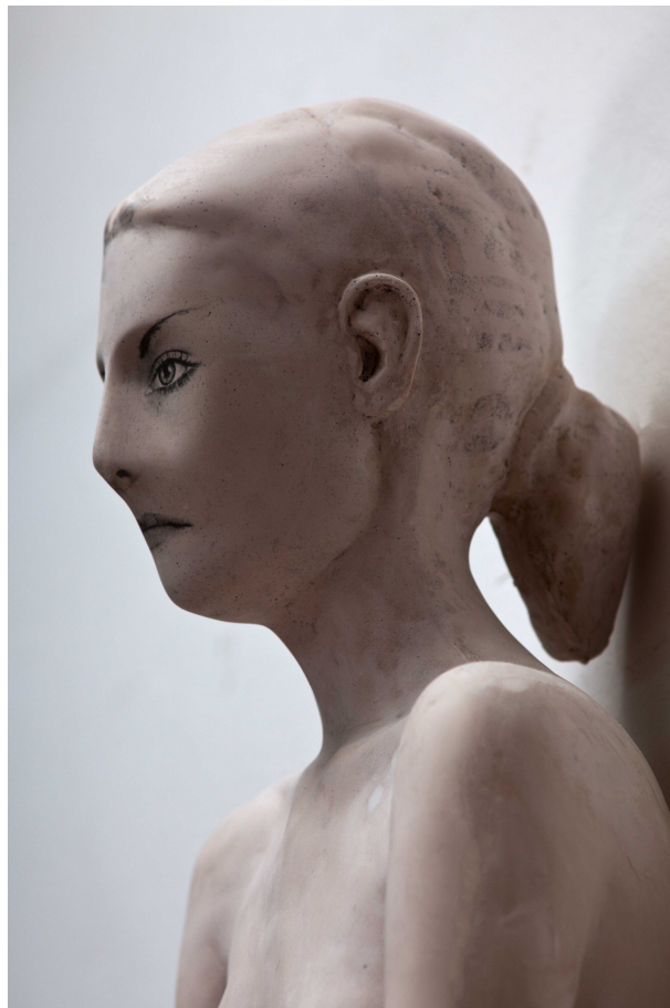
KATEŘINA (PROFIL), ACRYSTAL, FOTOGRAFICKÁ EMULZE, 84 X 88 X 52 CM, 2012.