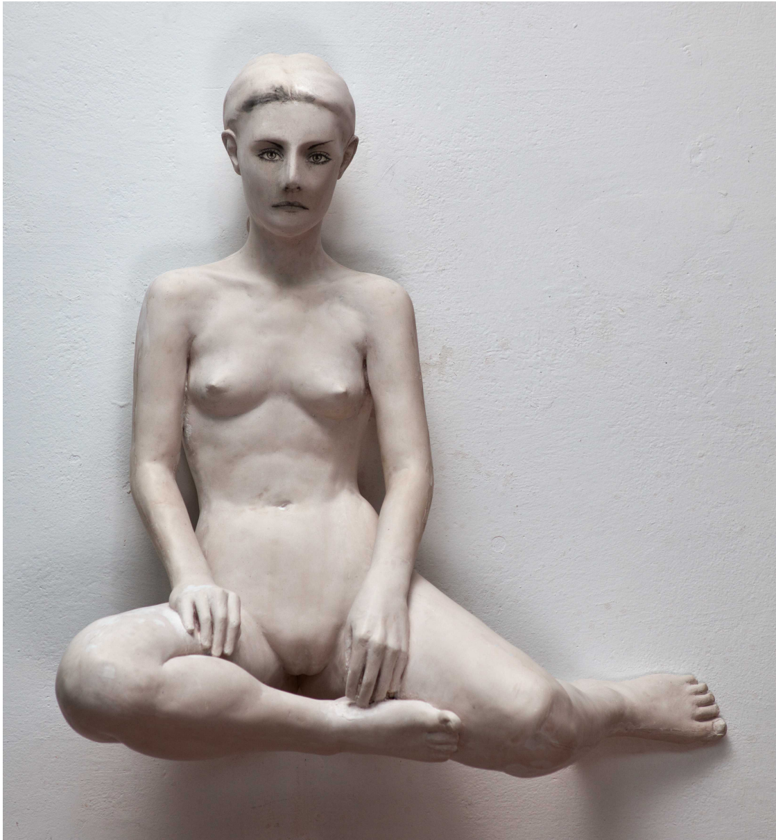
KATEŘINA , ACRYSTAL, FOTOGRAFICKÁ EMULZE, 84 X 88 X 52 CM, 2012.