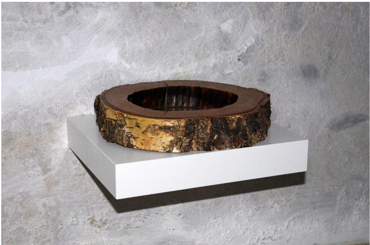
Studna, dřevo, zrcadlo, 25 cm, 2018