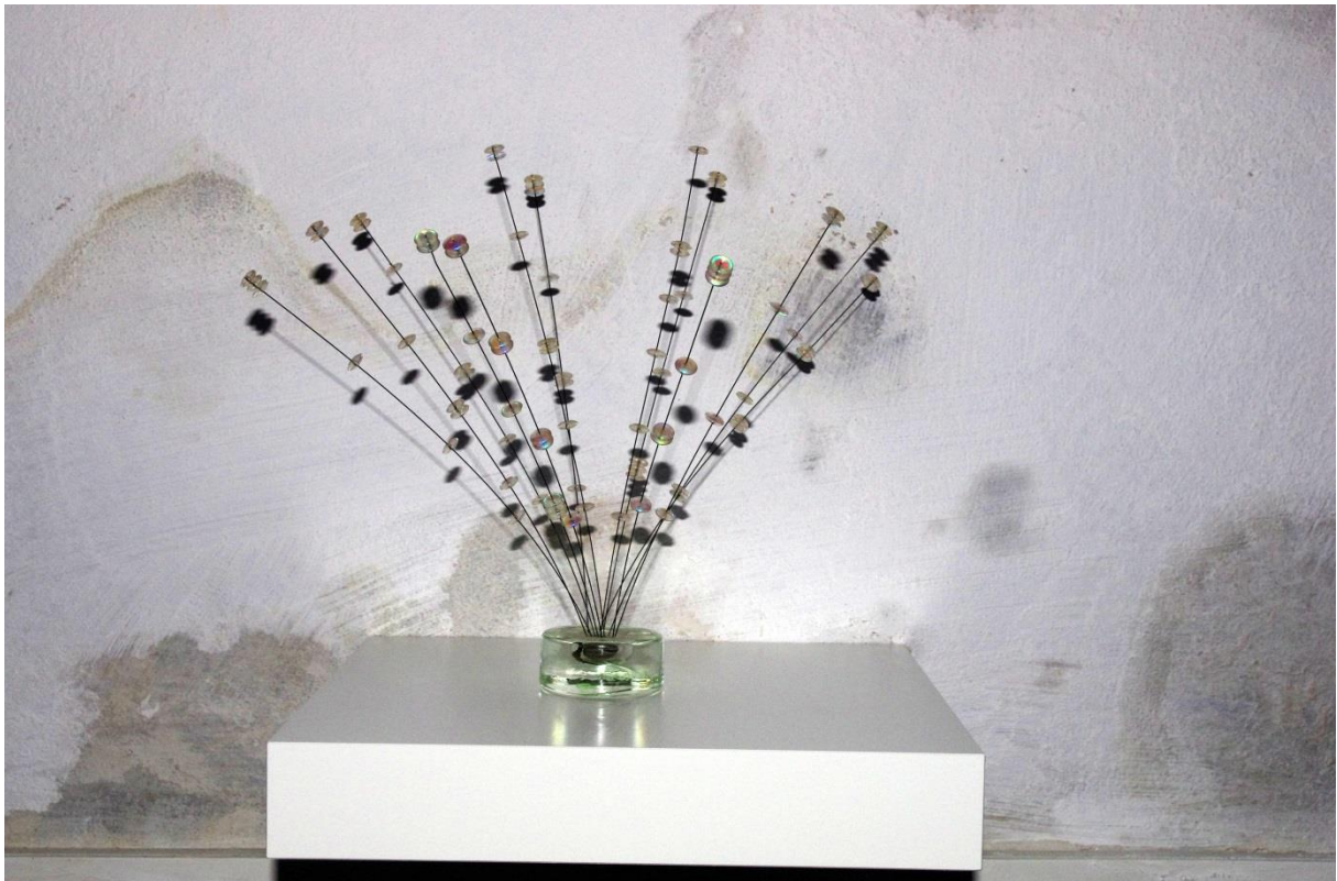
Páv, sklo, drát, 30 cm, 2018