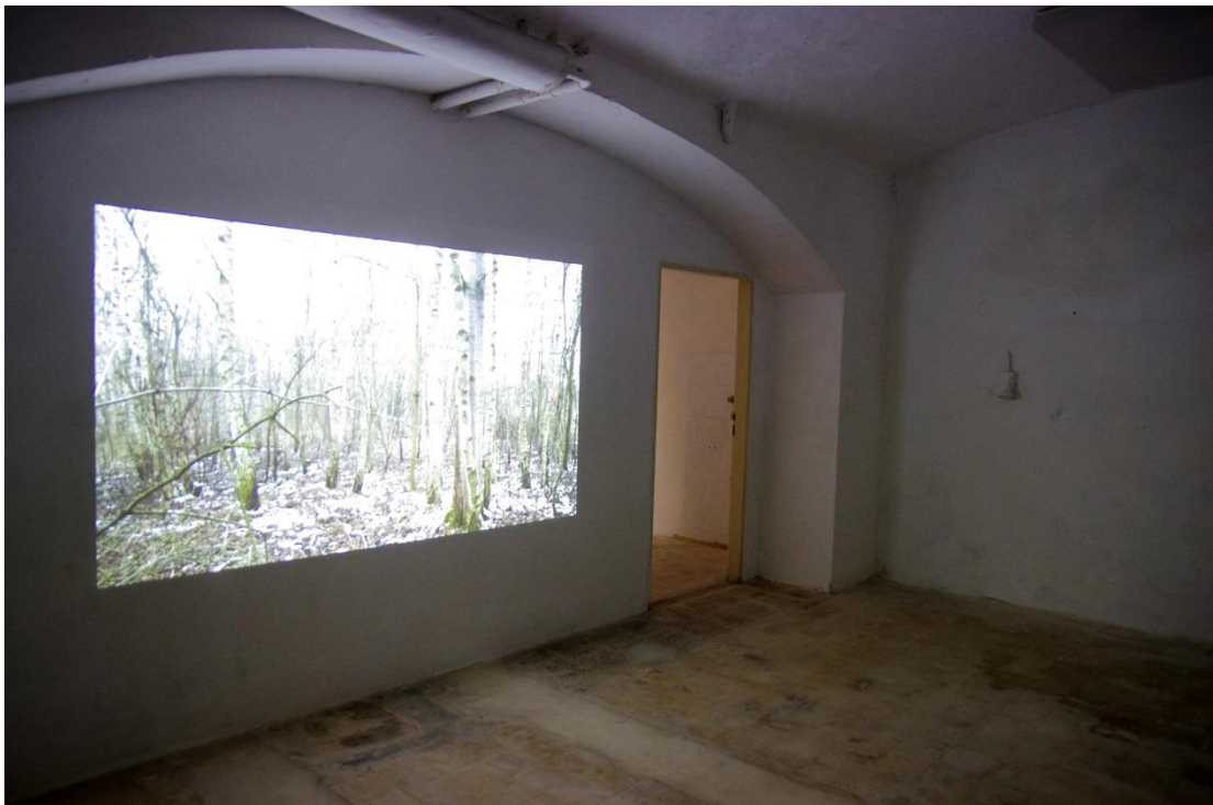
Bílá na bílé , digitální video ve formátu mpg, 00:02:36 ve smyčce, 2018; http://archiv.ffa.vutbr.cz/vskp/video/2018-cizek_uxova-nikol-usporadani