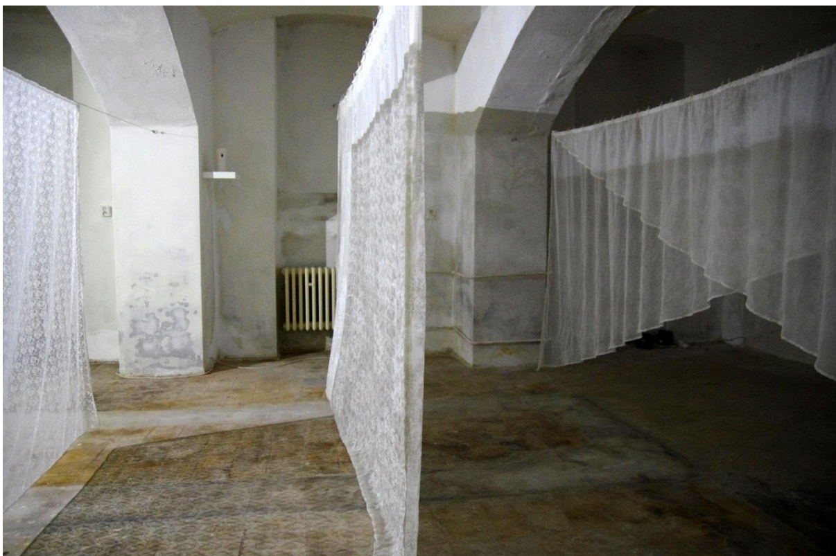
Uspořádání, místnost 1, textil, ocelové lano, reflektor, cca 5 x 10 m, 2018 (dočasná instalace 14. 4. – 18. 4. 2018, sklepní prostory budovy U2 FaVU VUT v Brně, Údolní 53)