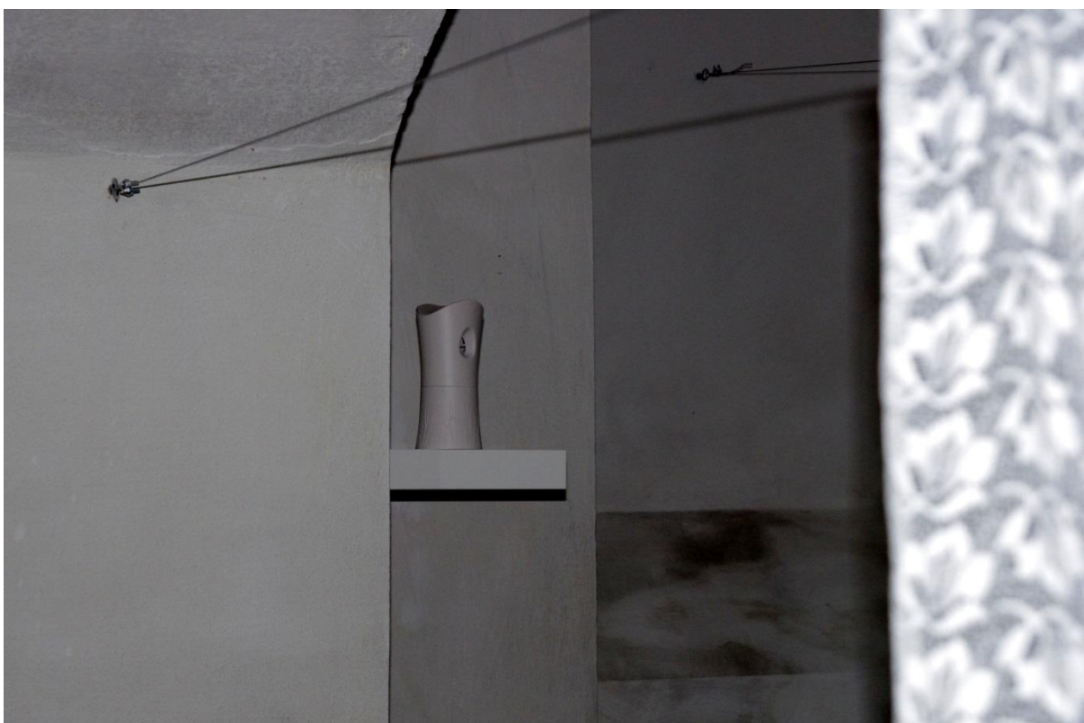
Uspořádání, místnost 1, textil, stolička, elektrický osvěžovač vzduchu, reflektor, cca 5 x 10 m, 2018 (dočasná instalace 14. 4. – 18. 4. 2018, sklepní prostory budovy U2 FaVU VUT v Brně, Údolní 53)