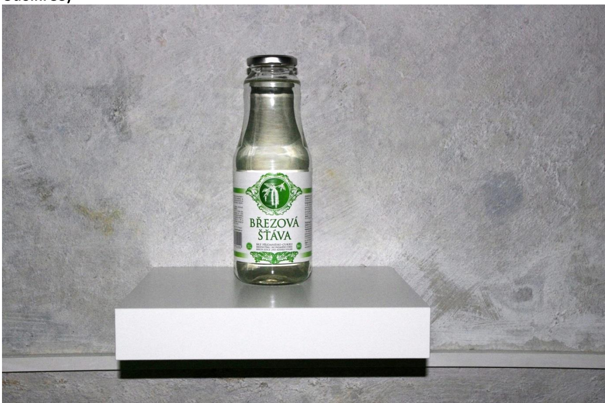
Medicína, sklo, 1 l, 2018