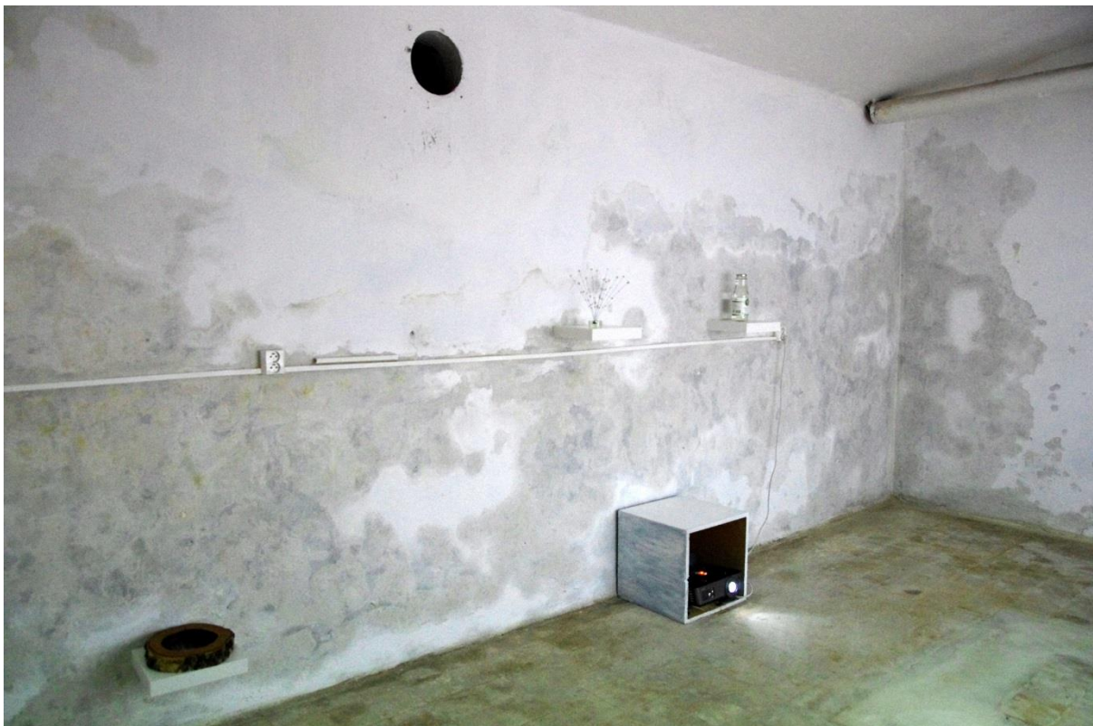
Uspořádání, místnost 2, police, objekty různých materiálů, videoprojekce, cca 5 x 3 m, 2018 (dočasná instalace 14. 4. – 18. 4. 2018, sklepní prostory budovy U2 FaVU VUT v Brně, Údolní 53)