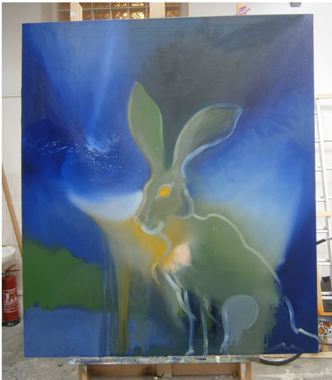
KOSMICKÝ ZAJÍC, OLEJ NA PLÁTNĚ, 160 X 140 CM, 2014

OBRAZOVÁ DOKUMENTACE K VŠKP K OBHAJOBĚ BYLO PŘEDLOŽENO DESET MALEB.