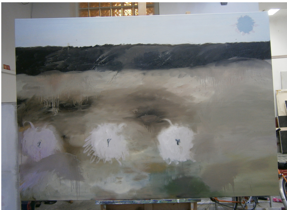
OVCE, OLEJ NA PLÁTNĚ, 220 X 170 CM, 2014