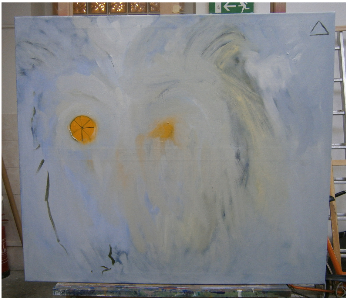
SOVA, OLEJ NA PLÁTNĚ, 95 X 110 CM, 2014