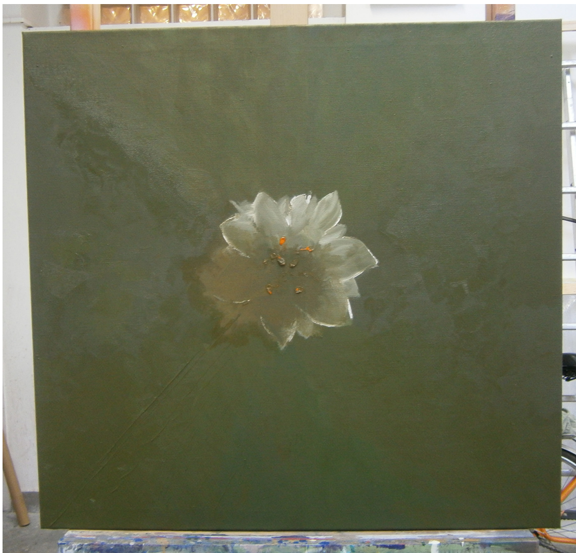
ČEMEŘICE, OLEJ NAPLÁTNĚ, 95 X 100 CM, 2014