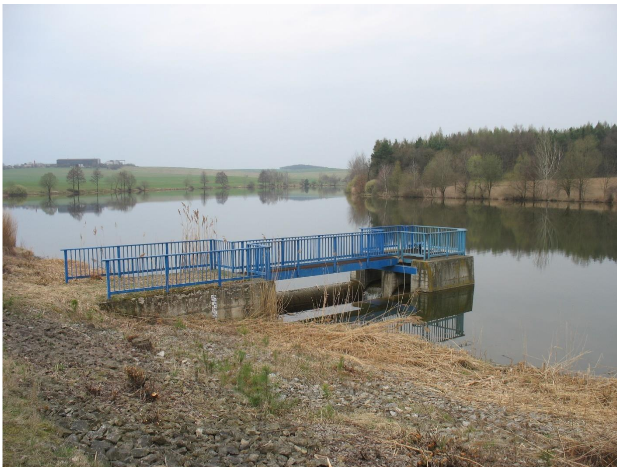
Obr. 2 Sdružený funkční objekt [8]