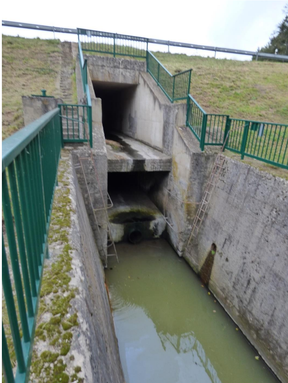
Obr. 3 Sdružený objekt a vývar [8]