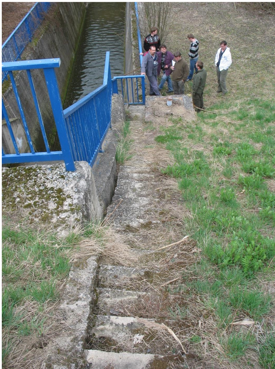
Obr. 7 Detail zborčeného schodiště na vzdušném líci

Dále dle [7] bylo zjištěno že schodiště vedoucí kolem skluzu na vzdušném líci jsou vlivem lokálního sednutí zborčené viz obr. 7. Doporučuji schodiště opravit a současně s tím i sanovat propadlý terén vzdušného líce pod schodištěm a také vpravo od něj směrem ke skluzu.