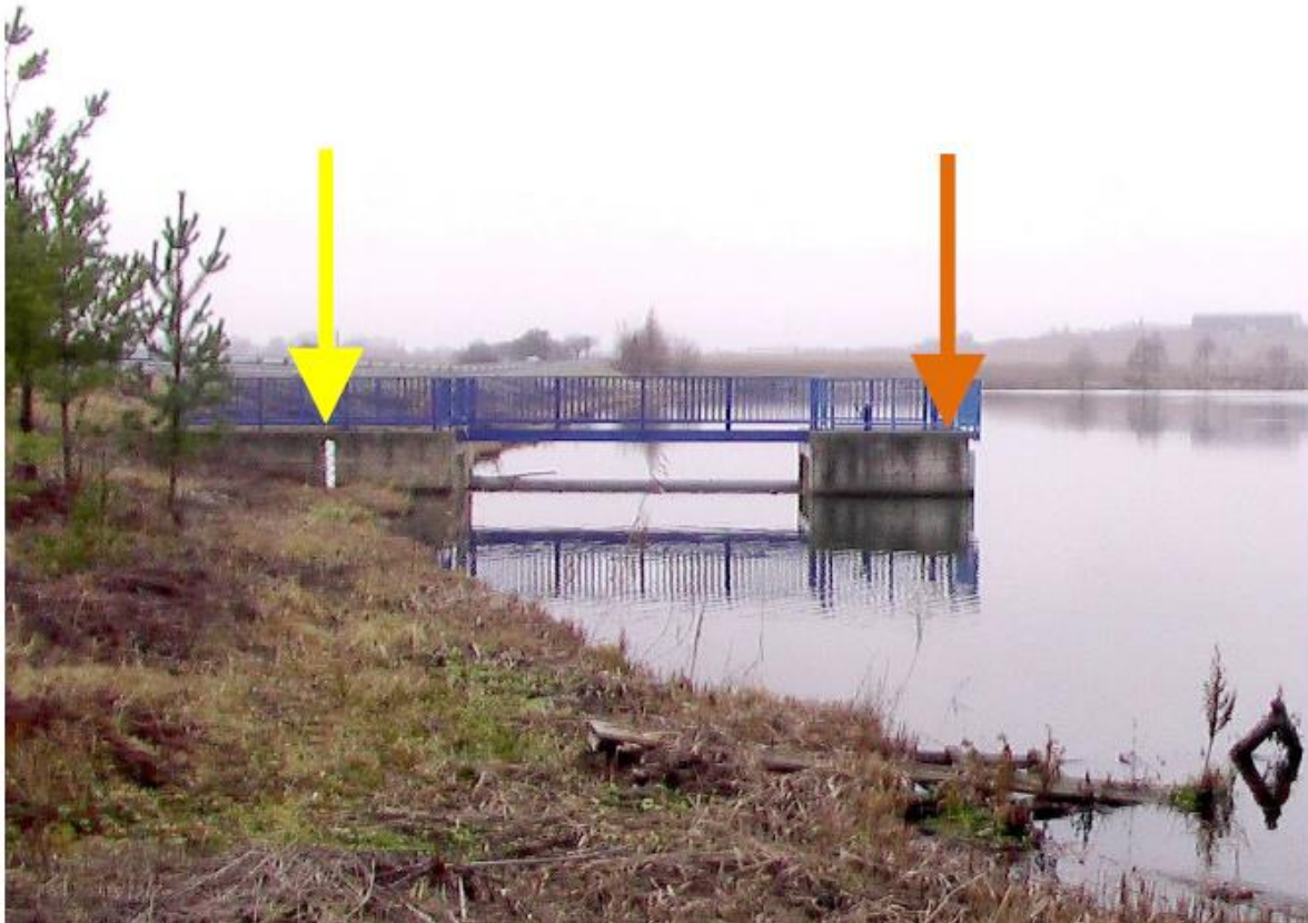
Obr. 6 Vodoměrná lat' (žlutá šipka je stávající stav, oranžová doporučený) [8]

Osazení vodoměrné latě, která je připevněná na sruženém objektu návodním jílcí v hrázi, na sružený objekt co nejvíce do zátopy viz obr. 6