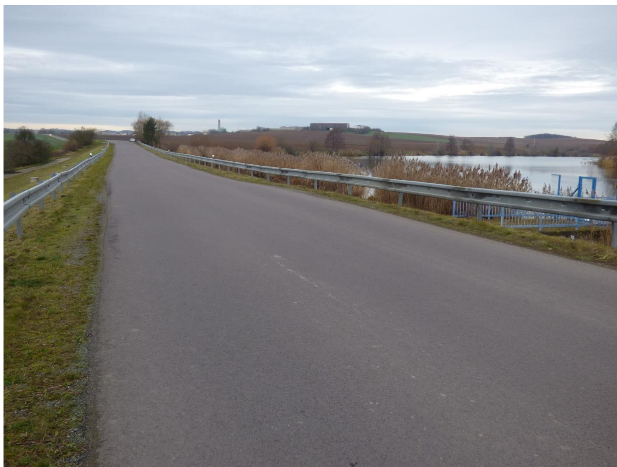
Obr. 1 Koruna hráze, asfaltová silnice III/12249 směr Rouchovany – Skryje [8]

* kóta přepočtená z [2] na novou úroveň zaměření dle [3] (připočteno 0,7 m)