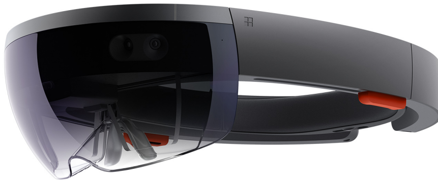
Obrázek 4.1: Microsoft HoloLens [94]

Princip fungování těchto brýlí je poměrně složitý, brýle se totiž skládají z několika vrstev. Ve VR headsetu se člověk přímo dívá na displeje, ze kterých jde obraz skrze čočky do očí. U HoloLensu se ale kombinuje promítnutý obraz s reálným světem. To je možné díky optickému systému skládajícímu se ze třech průhledných skleněných čoček (červená, zelená, modrá). Nad čočkami jsou jakési malé displeje či projektoři, Microsoft je nazval „light engines“, které promítají obraz na tyto čočky. Ty nejsou úplně hladké, ale nachází se na nich miniaturní vlnité drážky, které rozkládají a různě odrážejí určité paprsky světla. Tento princip osálí oči dostatečně na to, aby výsledná projekce hologramu působila prostorově a věrohodně. [95][96]