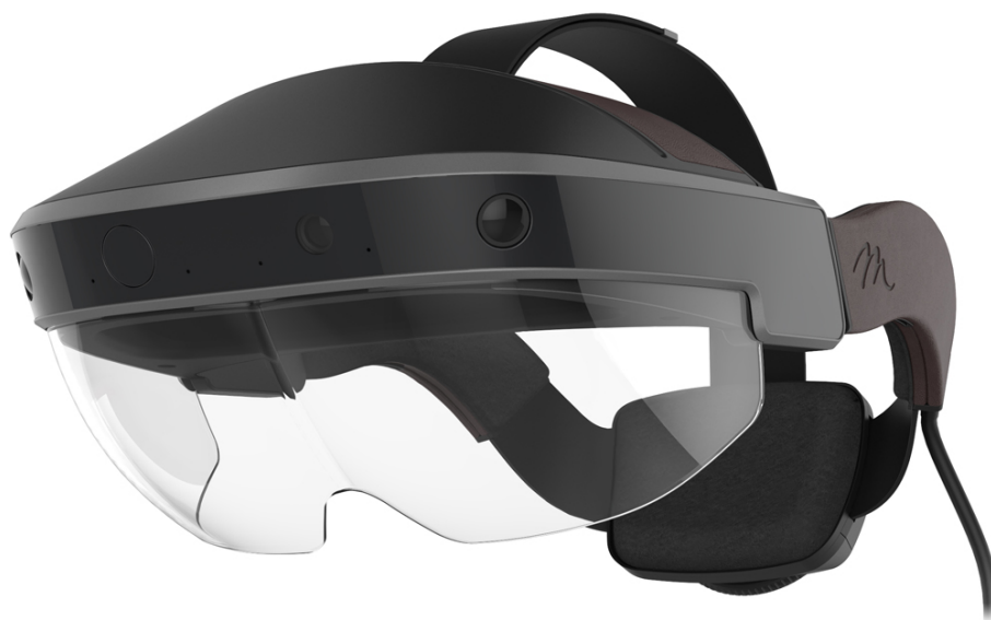
Obrázek 4.7: Meta 2 [120]

Meta je soukromá americká společnost se sídlem v Silicon Valley. Její první AR brýle Meta 1 se dnes již neprodávají, nyní je na trhu dostupný druhý model, Meta 2 Development Kit. Zatímco většina AR headsetů se snaží pouze o vytvoření jakéhosi overlaye ve stylu displeje, Meta má stejný cíl jako HoloLens: vytvořit pro uživatele smíšenou realitu vložím hologramů do reálného světa. Metě 2 se to daří pouze částečně, její obraz vypadá méně reálně, více jako umělá projekce, headset musí být připojen k počítači a dokonce i její tvůrci uznávají, že mapování reálného světa má zatím značné nedostatky. Na druhou stranu je zde velký cenový rozdíl mezi oběma zařízeními, Meta 2 stojí pouze 949$ oproti 3000$ za HoloLens. [119]