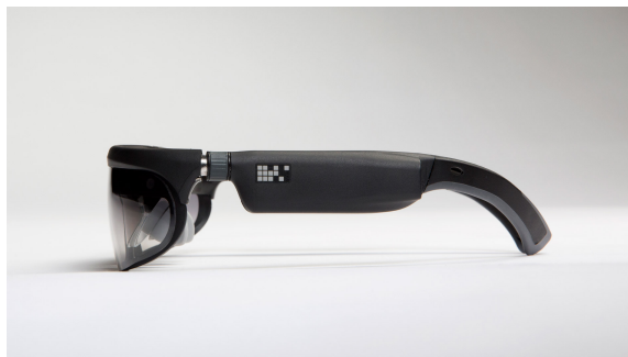
Obrázek 4.4: ODG R8 [105]