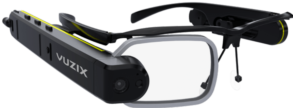
Obrázek 4.6: Vuzix M3000 [115]

Na rozdíl od Bladu, jehož využití pokrývá spíše volnočasové aktivity, M3000 byly navrženy pro komerční a profesionální účely, uplatnění by v budoucnu mohl najít například v průmyslu, logistice, prodeji či medicíně. Brýle jsou připraveny k práci v náročném prostředí, jsou totiž odolné vůči nárazu, prachu a vodě. M3000 lze nosit připevněné na klasické brýle, nebo prázdné obroučky, ale také na bezpečnostní přilby. [115][116][118]