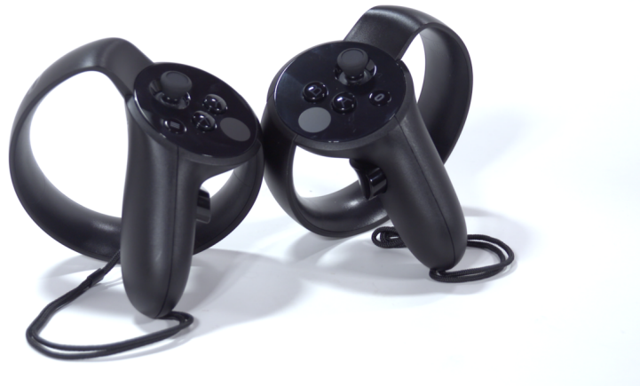
Obrázek 3.4: Oculus Touch [38]

tém Oculus Touch. Jedná se o dvojici bezdrátových ovladačů s thumbstickem a několika tlačítky. Na designu lze poznat, že se tento model inspiroval dříve používaným Xbox ovladačem. Pohyb Touche je snímán stejnou nízko odezvovou technologií, která určuje relativní polohu headsetu. Ovladače potřebují každý po jedné AA baterii. [30][33]