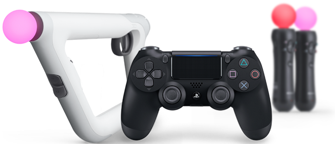
Obrázek 3.6: Ovladače pro PSVR [44]

Tracking systém u PSVR je velmi jednoduchý. Kamera snímá polohu devíti LEDek na headsetu, respektive polohu a vzdálenost koulí s LEDkami na koncích ovladačů. Poloha headsetu je snímána velmi přesně, avšak snímání ovladačů nemusí být vždy úplně přesné. Menším problémem je také citlivost na světelné podmínky, svítí-li například z okna ostré světlo, může to zneprávnit celý proces. [50][51][52]