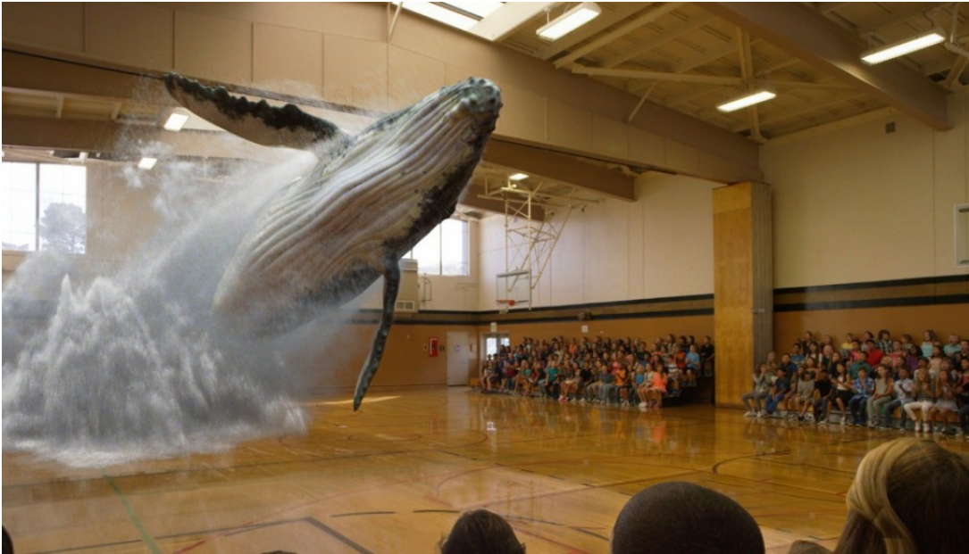
Obrázek 4.8: Magic Leap promo [126]