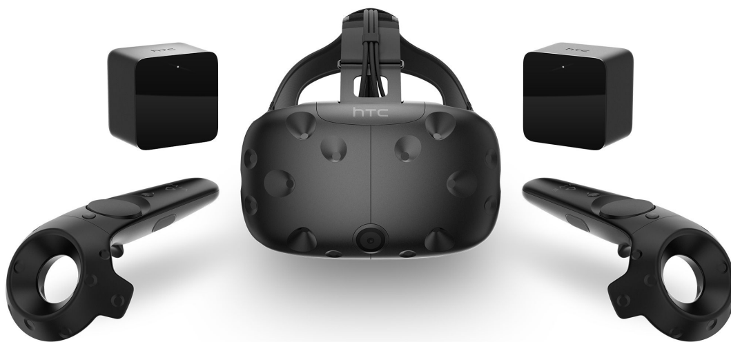
Obrázek 3.1: HTC Vive s příslušenstvím [24]

Uvnitř headsetu je dvojice OLED displejů o obnovovací frekvenci 90Hz a celkovém rozlišení 2160x1200 pixelů (tedy 1080x1200 pro každé oko). Displeje pokrývají zorné pole o rozsahu 110 stupňů. Vive stejně jako Oculus využívá fresnelovy čočky. V případě mírného poklesu FPS se zapne opatření zvané „asynchronous reprojection“. To v praxi znamená, že se vybraný snímek zobrazí dvakrát za sebou, podruhé však v mírně pozměněné podobě tak, aby co nejvíce vyhovoval aktualizované informaci o poloze hlavy. V případě radikálnějšího poklesu FPS se aktivuje „interleaved reprojection“, v tomto případě se bude renderovat pouze každý druhý snímek, tedy 45 FPS. Díky tomu bude obraz stále relativně plynulý i při pohybu hlavou. Uvnitř samotného headsetu je dostatek místa i na dioptrické brýle a na boku headsetu je otočný kolík umožňující změnit vzdálenost čoček mezi sebou pro maximální ostrost a kvalitní 3D. Vzdálenost čoček od očí lze také upravit pomocí jednoduchého manévru s držáky náhlavního popruhu. Stabilitu na hlavě zajišťují tři nastavitelné elastické popruhy. Ze zadní strany headsetu vedou přibližně pět metrů dlouhé kabely zajišťující spojení s počítačem. Váha headsetu je 555 gramů. [10][11][12][13][14]