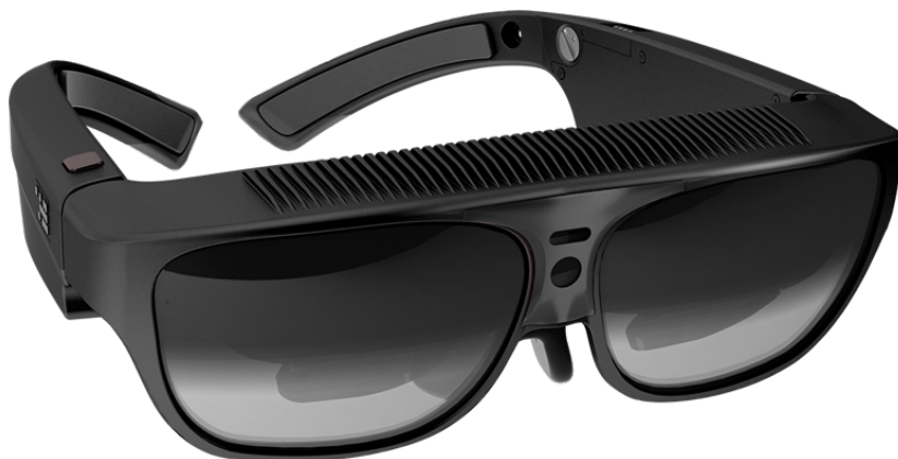
Obrázek 4.2: ODG R7 [102]

HD kamerou zachycující pohled uživatele, chybět samozřejmě nesměly ani poziční senzory. [101][103][108]