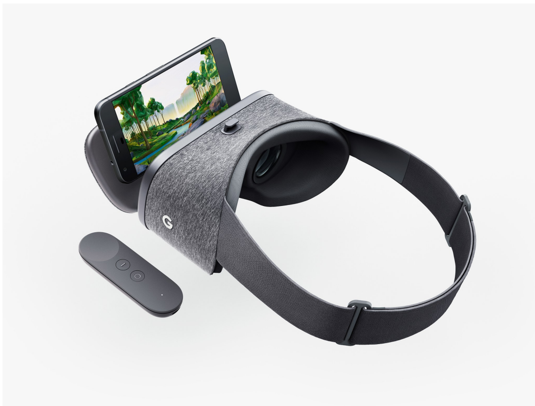
Obrázek 3.9: Google Daydream View [85]

pro snímání pohybu hlavy. Zatím je však na trhu pouze několik telefonů, které se mohou pochlubit označením Daydream-ready, Google však oznámil, že by tyto řady v budoucnu rozšířil například ASUS či Huawei. Daydream se v mnohém podobá Gearu od Samsungu s tím rozdílem, že není omezen na využívání telefonů jedné jediné značky. [78][79]