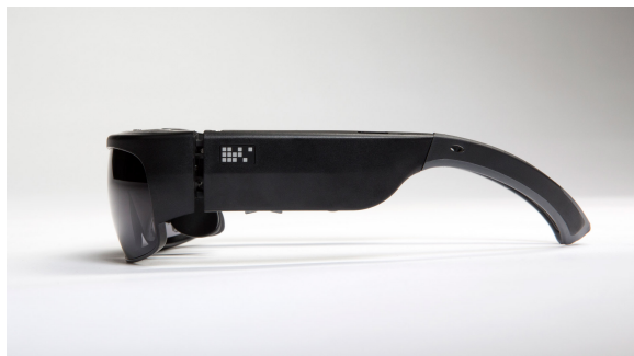
Obrázek 4.3: ODG R9 [105]