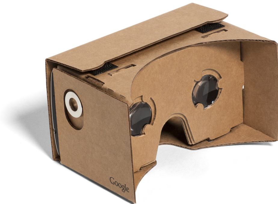
Obrázek 3.8: Google Cardboard [68]

Google Cardboard je opravdu jednoduchá platforma k používání, žádné složité zapojování, či instalace. Stačí stáhnout oficiální aplikaci jménem Cardboard z Google Play nebo z AppStore, která upravuje obraz na displeji do 3D formátu. [69][73]