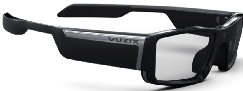
Obrázek 4.5: Vuzix Blade 3000 [114]

Vuzix Blade 3000 Smart Sunglasses z venku na první pohled vypadají jako obyčejné sluneční brýle a až po nasazení uživatel zjistí, že pravé sklo slouží jako displej. Pokud se oko na displej soustředí, obraz je ostrý a čistý, pokud se však uživatel dívá skrz brýle, sklo působí průhledně. [109]