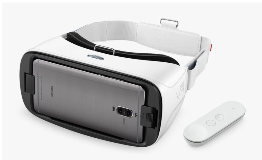
Obrázek 3.10: Huawei Daydream [86]

Google již dříve prohlásil, že přestože má svůj vlastní VR headset (Google Daydream View), chce spolupracovat na vytváření Daydream-ready headsetů i s ostatními společnostmi a nabídnout tak zákazníkům větší možnost volby. Jak to vypadá v praxi nám jako první ukázal Huawei. Datum jeho vydání zatím nebylo oznámeno, pravděpodobně by se však mělo jednat o červen 2017 a s největší pravděpodobností půjde používat pouze s telefony vlastní značky. [87]