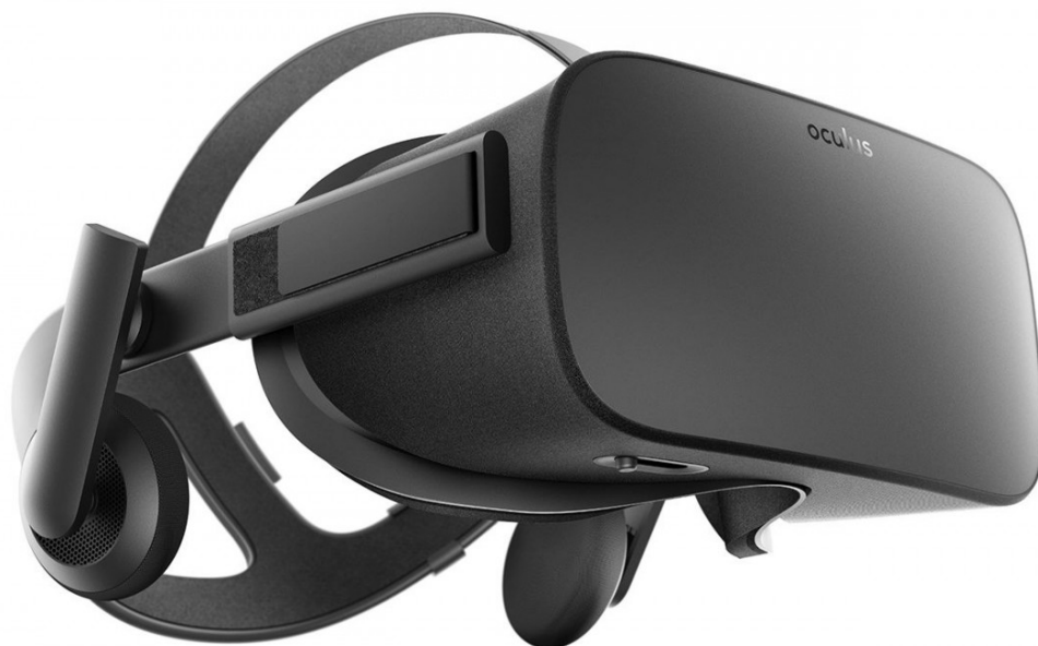
Obrázek 3.3: Oculus Rift [24]

Uvnitř headsetu je dvojice OLED displejů o obnovovací frekvenci 90Hz celkovém rozlišení 2160x1200 pixelů. Displeje pokrývají zorné pole o rozsahu 110 stupňů. Headset váží 470 gramů, má nastavitelné popruhy a s jeho používáním by neměli mít problém ani uživatelé s dioptrickými brýlemi. V souvislosti s Riftem se hodně mluví o „screen door“ efektu, což je viditelná mezera mezi jednotlivými pixely. Podobný problém se však objevuje i u konkurence. Tento jev se existoval již u starých počítačových monitorů, ale postupem času zanikl s tím, jak se hustota pixelů zvětšovala. Podle AMD bude tento problém úplně odstraněn až s nástupem 116 megapixelových displejů. Oculus využívá hybridní Fresnelovy čočky, které z části redukuje screen-door efekt a jejich další výhodou je nižší hmotnost oproti čočkám klasickým. Jejich menší nevýhodou je to, že obraz může vypadat trochu rozmazaně, pokud se na displeji objeví světlý objekt před tmavým pozadím. Vzdálenost čoček může být upravena pomocí malé páčky na spodní straně headsetu. [30][31][32][33][34]