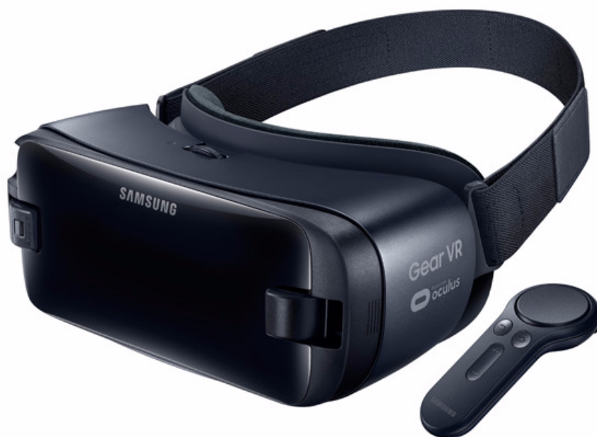
Obrázek 3.7: Samsung Gear VR [58]

Gear VR je společným počinem OculusVR a jihokorejského Samsungu. Spolupráci poprvé navázali, když Oculus potřeboval dodavatele kvalitních OLED displejů pro svůj Rift. V té době Samsung předložil na stůl svůj prvotní návrh Gearu, avšak spoluzakladatel Oculu, Brendan Iribe, byl vůči myšlence mobilní VR skeptický. Po několika měsících vývoje se však tato myšlenka stala realitou. Zajímavostí je, že Samsung vlastnil patent na HMD (head mounted display) využívající mobilní telefon již od roku 2005. Samsung se stará o hardware, Oculus pak o softwarovou stránku věci. Zanedlouho od navázání spolupráce byla vydána první verze, konkrétně v prosinci 2014. Skutečný průlom však znamenal až Samsung Gear VR (20. listopadu 2015) a jeho novější verze také se jmenující Samsung Gear VR (vydaná 18. srpna 2016). Následující řádky budou popisovat novější verzi. [57]