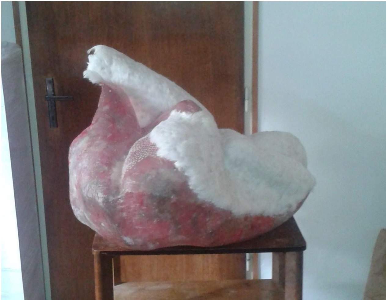
Pouzdro – otisk, laminát, peří, 106 x 76 x 67, 2015-05-22

K obhajobě byla předložena 1 socha (fotodokumentace je zatím provizorní, bude dodána do 10 dnů po bakalářských obhajobách)