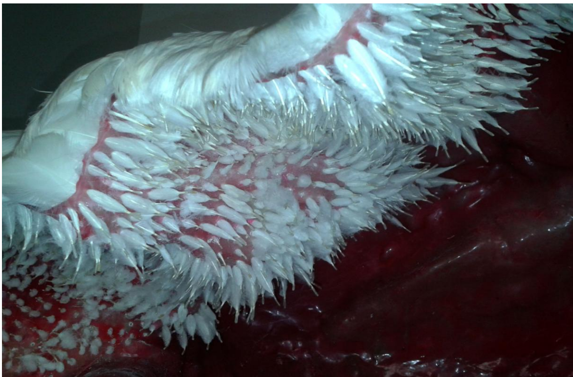
Pouzdro – otisk, laminát, peří, 106 x 76 x 67, 2015-05-22