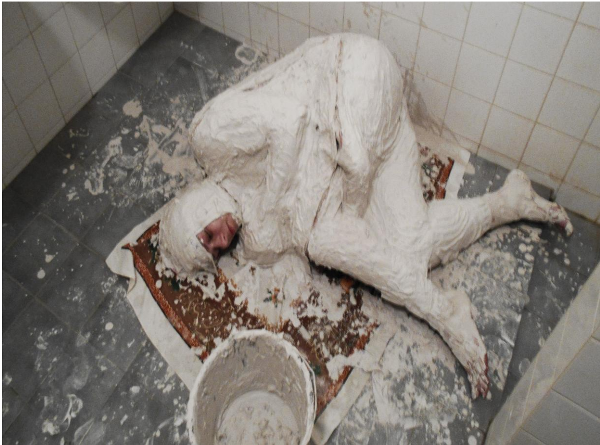
Odlitek těla, sádra, 2015