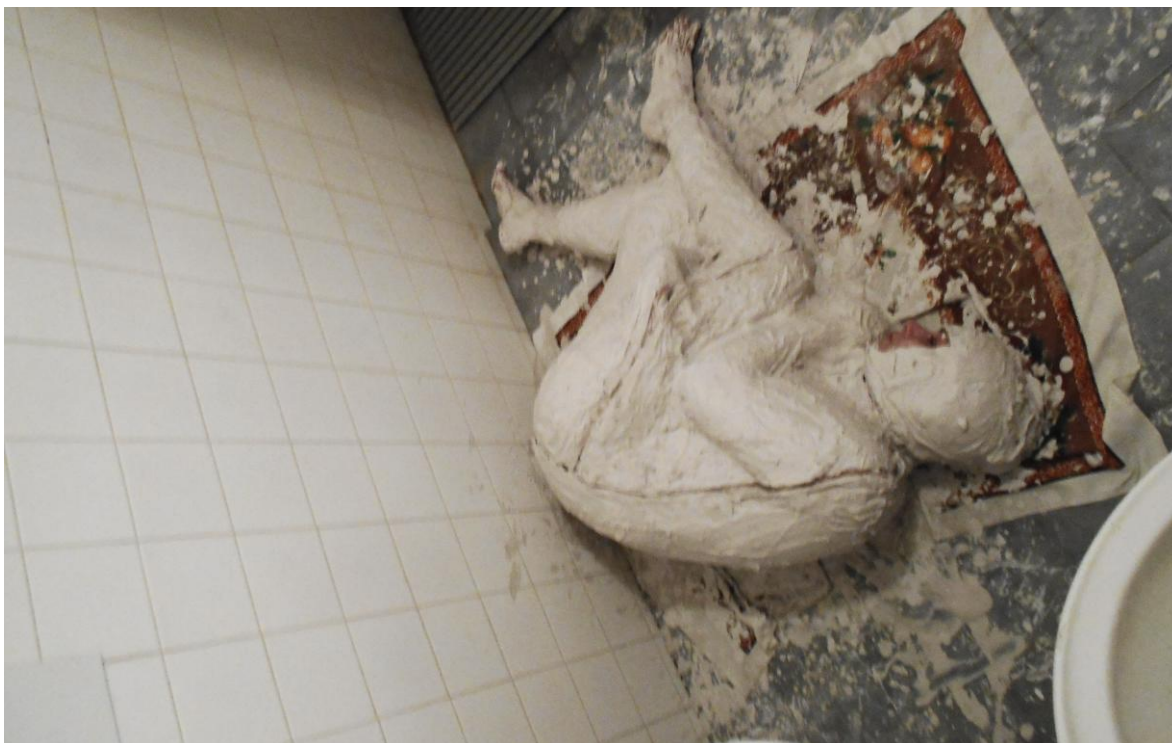
Odlitek těla, sádra, 2015