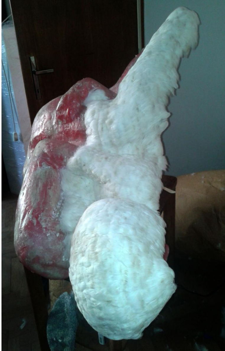
Pouzdro – otisk, laminát, peří, 106 x 76 x 67, 2015-05-22