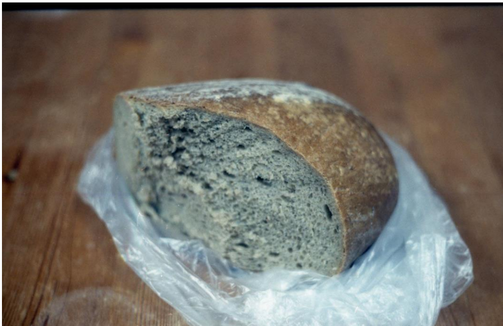
Peter , fotografia , 90 x 60 cm, 2018