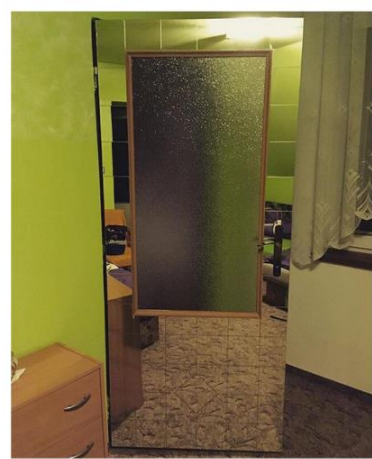
Ukážka mojich starších fotografických záznamov

Čo vedie niekoho k tomu, nakresliť si na sadru znak adidas? Prečo sú na zemi vreckovky s mačiatkom a komu patria? Kto a prečo si dal tú námahu a vytvoril zrkadlové dvere? Takéto otázky sa vo mne vynoria vždy v momentoch, keď zažijem niečo pre mňa nevidané a nepoznané, čo si chcem pamätať a k čomu sa môžem práve vďaka zakonzervovaniu momentu vo fotografii spätne vrátiť. Čaro takýchto okamihov má pre mňa silu najmä kvôli neúplnosti ich príbehu, vďaka čomu zostanú visieť niekde v nedopovedanom vzduchoprázdne.