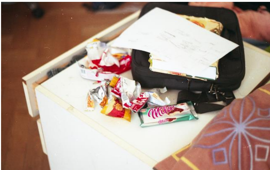
Miroslav , fotografia , 90 x 60 cm, 2018