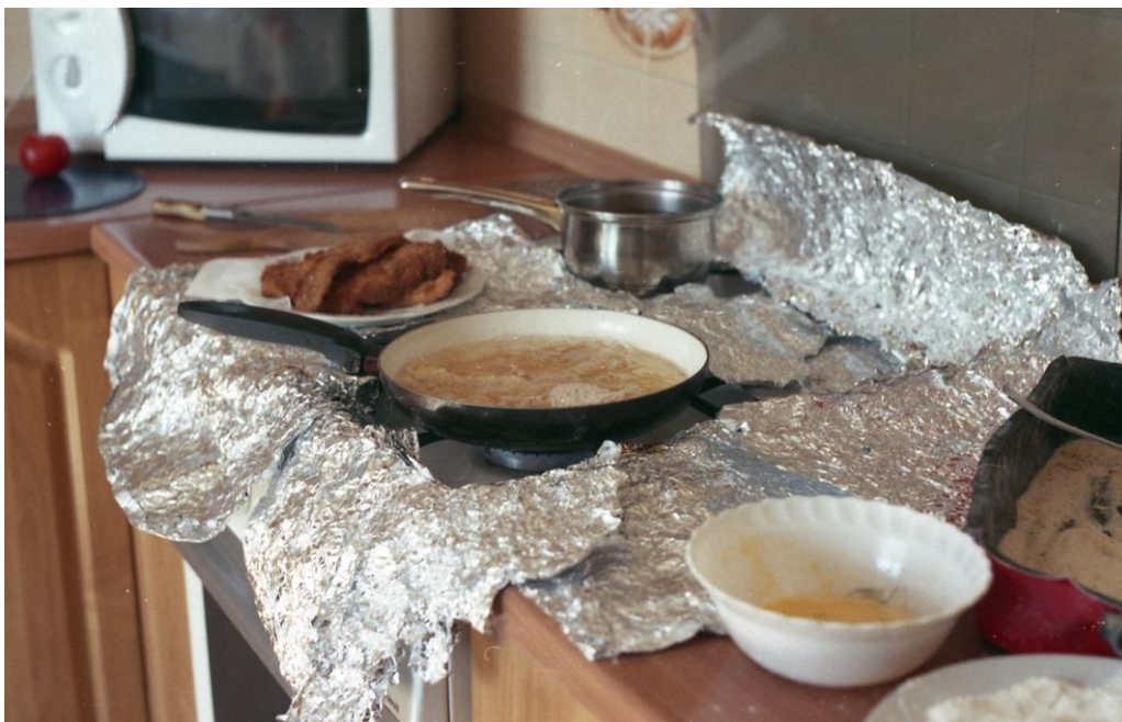
Marta, fotografia, 90 x 60 cm, 2018