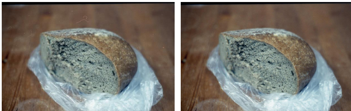
Ukážka retuše fotografií použitých v súbore

vyčistila od rušivých elementov. Žiadne ďalšie zmeny, ako ladenie kontrastu, farieb alebo ostrosti, som na fotografiách nevykonávala.