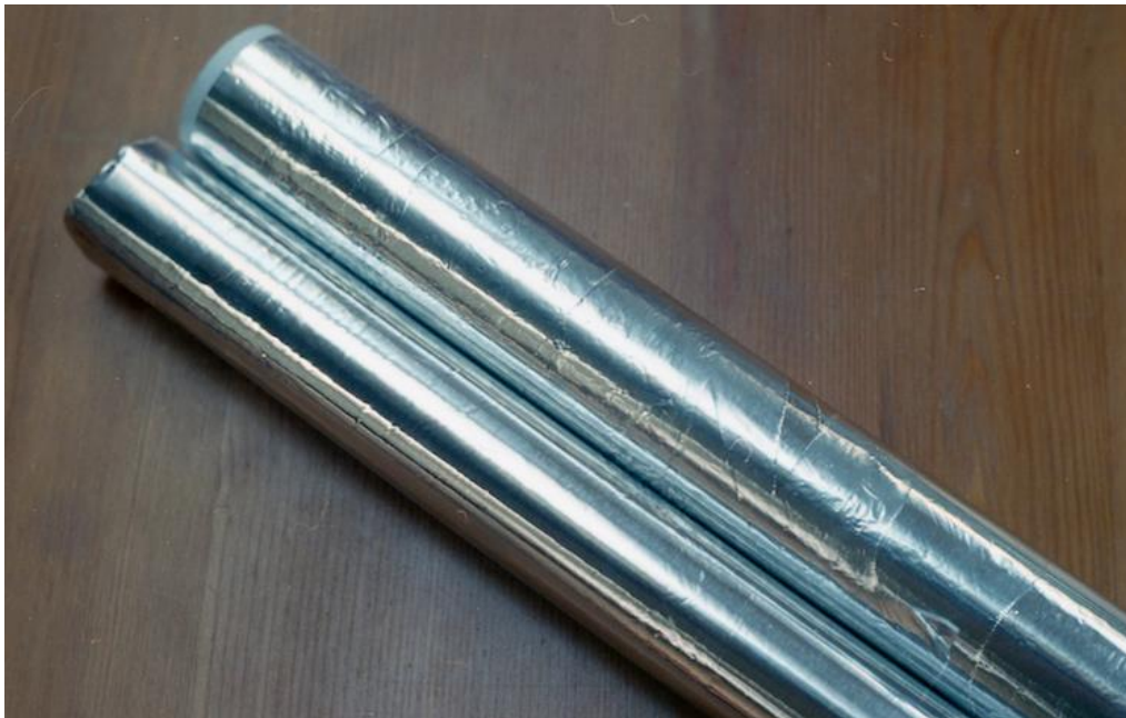
Lukáš , fotografia , 90 x 60 cm, 2018