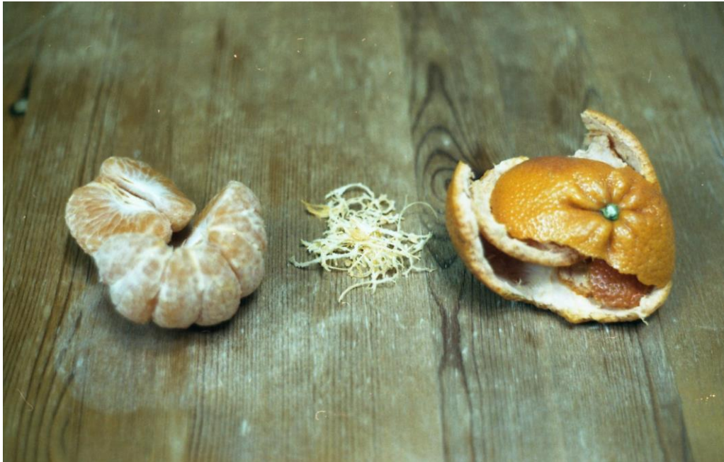
Dominik, fotografia, 90 x 60 cm, 2018