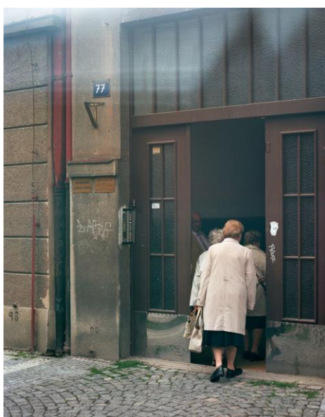
Bez názvu , Lukáš Jasanský – Martin Polák, fotografia z cyklu Keep Knocking, 2011.