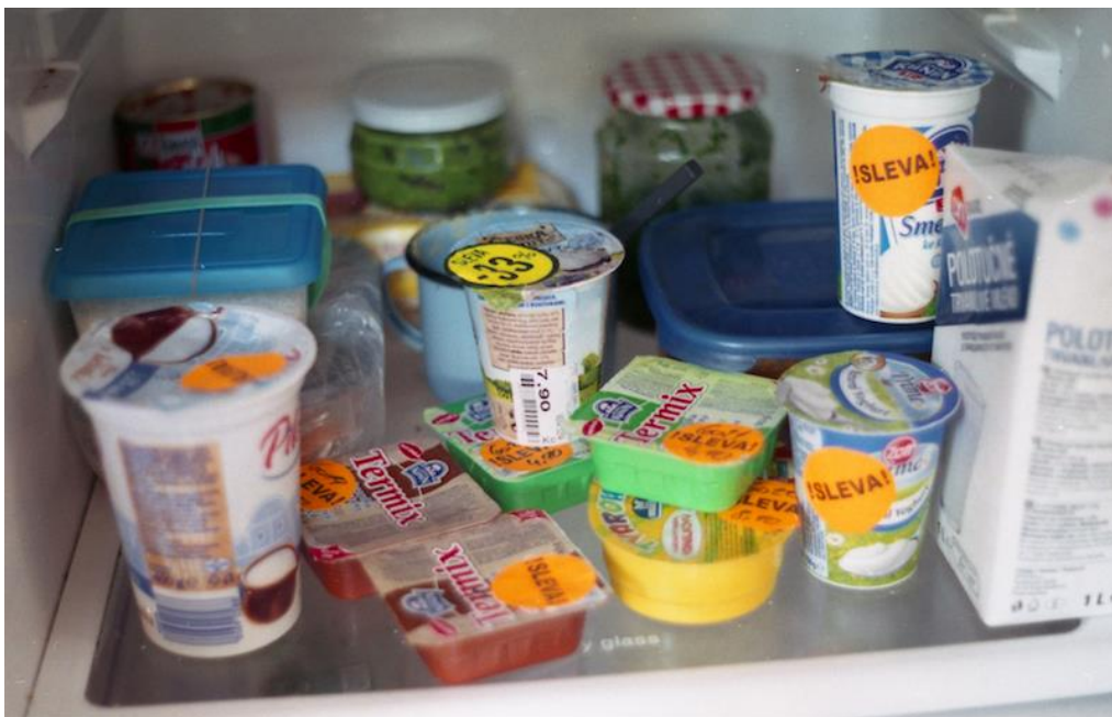
Mikuláš , fotografia , 90 x 60 cm, 2018