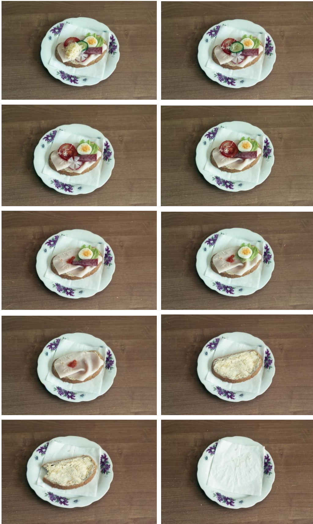
Lucia , séria fotografií, 45 x 30 cm, 2018