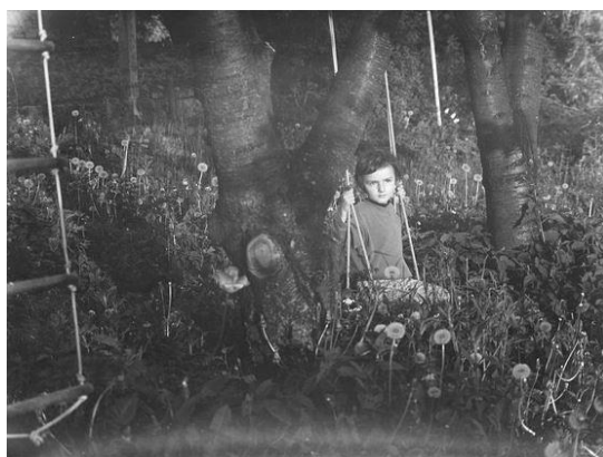
Bez názvu , Michal Kalhous, fotografia z cyklu Rýč, míč, klíč, 2010-11

Dokumentární fotografie se vyznačuje nesmyslnou tematikou, vychází z objektivní skutečnosti, je založena na faktech a událostech společenského života, politiky, kultury, vědy i na událostech rodinného života v jeho intimitě; dokumentární fotografie reflektuje bezprostředně život, „je život sám.“ 7