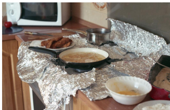
Marta , fotografia, 90 x 60 cm, 2018

Zaujímavou témou pre dokumentovanie sa stali aj nevšedné chute, kombinácie a vylepšenia klasických jedál. V sérii nájdeme napr. fotografiu zachytávajúcu „Knedlo, vepřo, zelo“, ktoré stará mama môjho známeho dopĺňa zaváranými broskyňami.