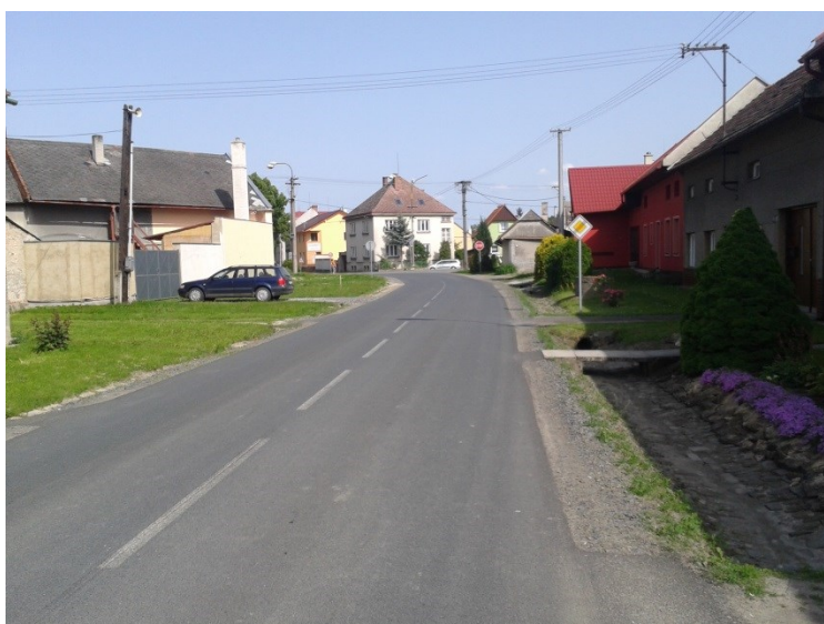
Obec Vlkoš, konec úseku