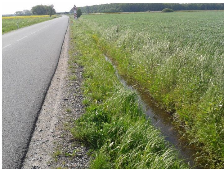
Špatné odvedení vody z příkopu