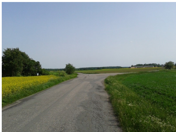
Křížení silnic III/4348, III/4349 a účelové komunikace