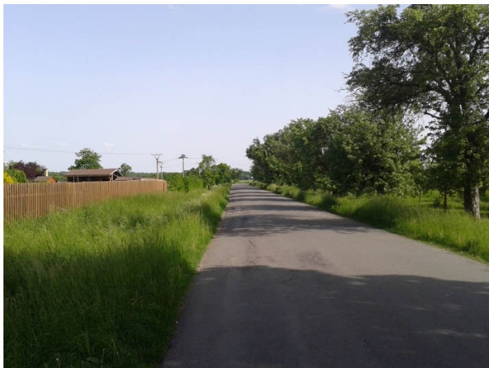
Začátek úseku, pohled z obce Troubky.