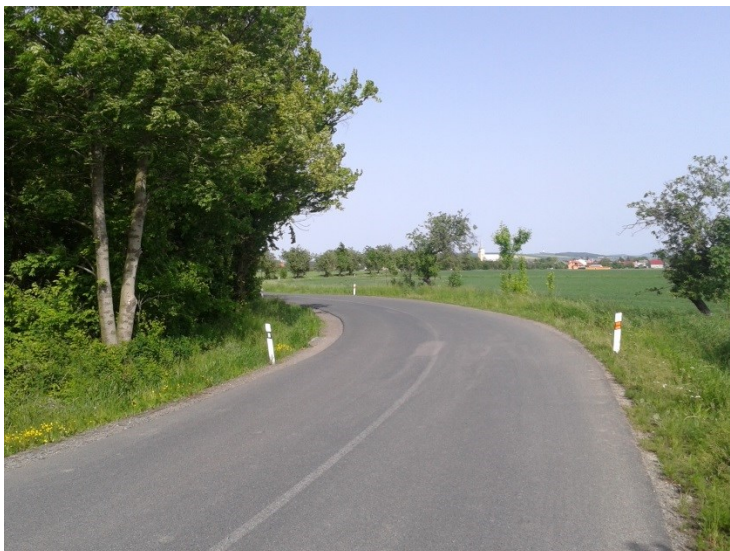
Malý poloměr oblouku, nedostatečný rozhled pro zastavení