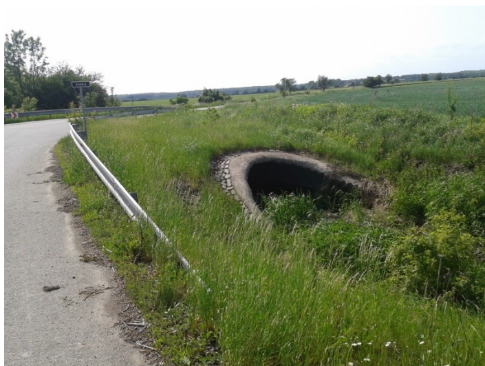
Poloměr oblouku 48 m, propustek Tubesider DN 1500