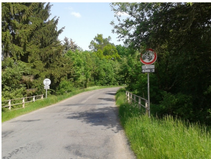
Rámový propustek km 1, 410 70, Malý poloměr oblouku, nedostatečné klopení, chybějící rozšíření, nedostatečný rozhled pro zastavení