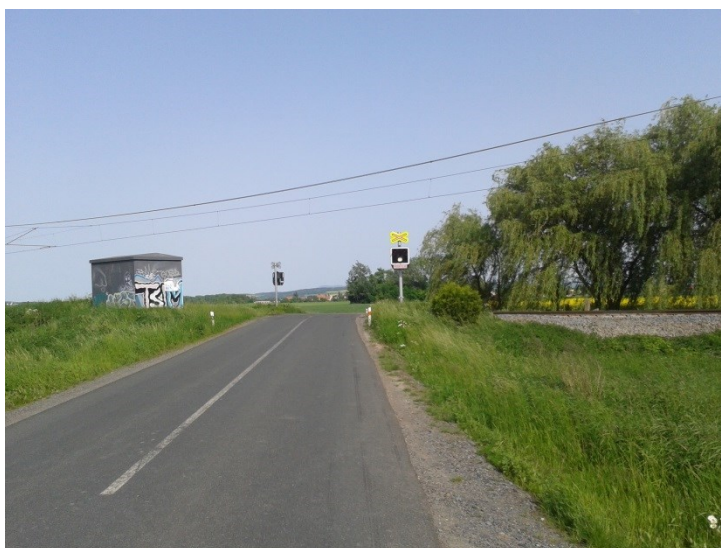
Křížení se železnicí (pohled od Troubek)