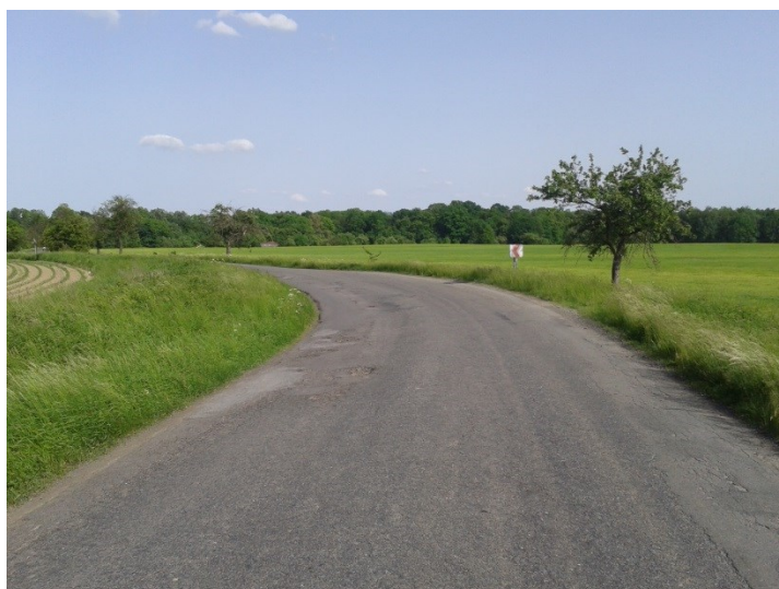
Malý poloměr oblouku, nedostatečné klopení, chybějící rozšíření