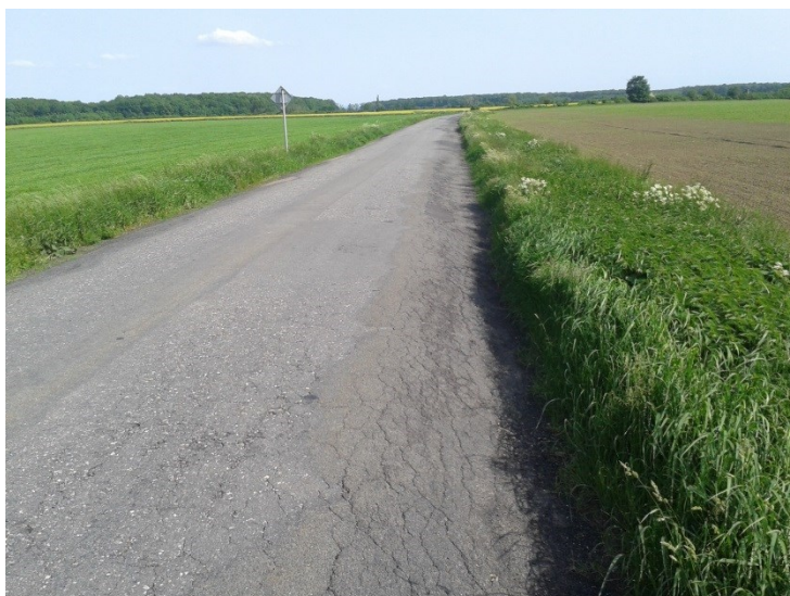
Propadlá krajnice vozovky