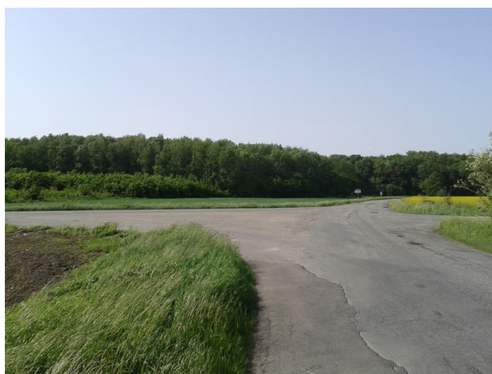
Křížení silnic III/4348, III/4349 a účelové komunikace