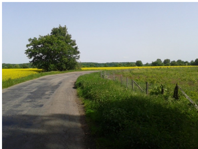
Oblouk o poloměru 58 m, propadající se krajnice