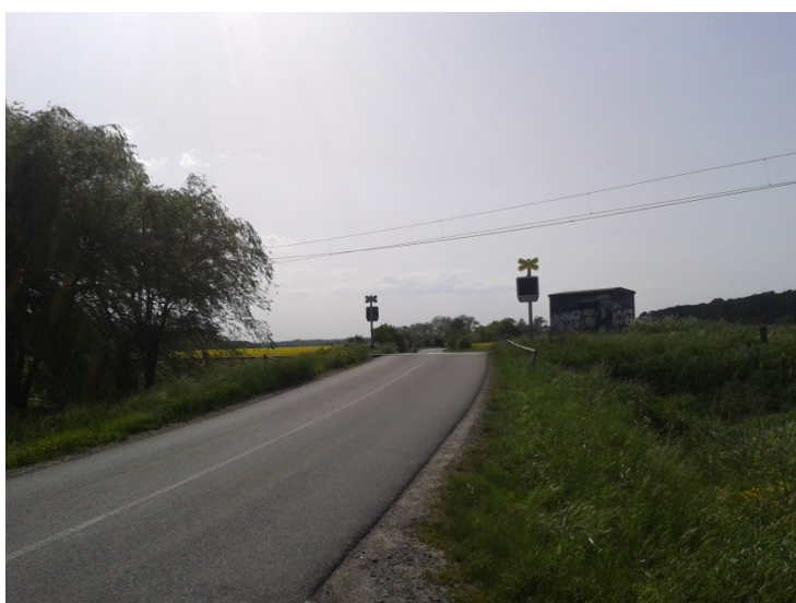
Křížení se železnicí (pohled od Vlkoše)