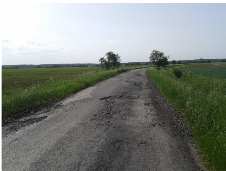
Rozpadající se kryt vozovky