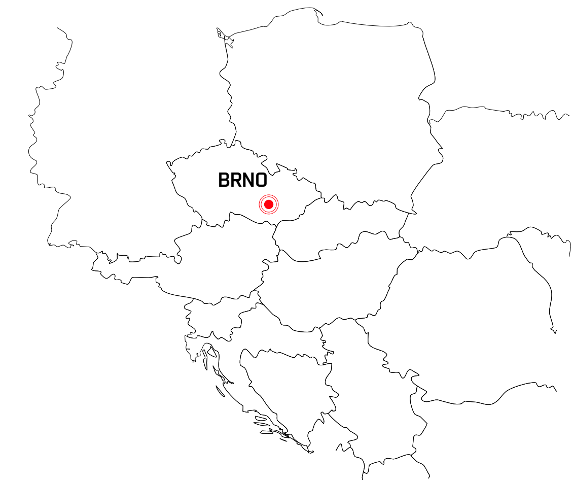
CENTRUM INFORMAČNÝCH TECHNOLOGIÍ