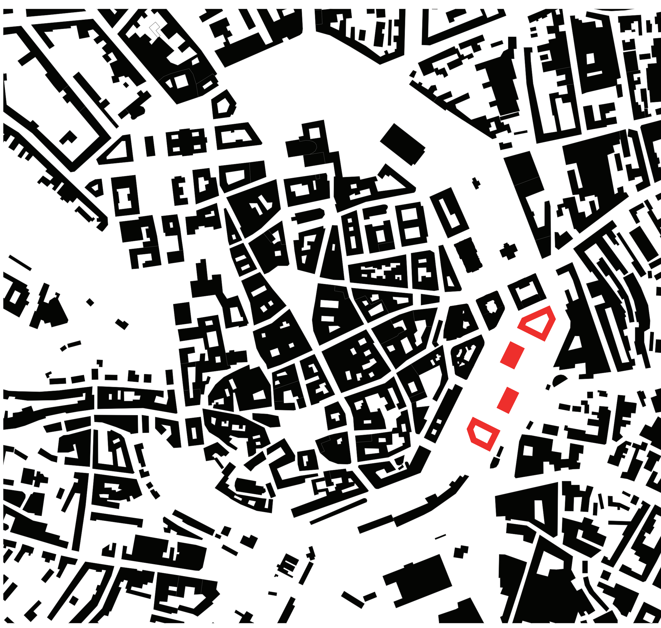
SITUÁCIA ŠIRŠÍCH VZŤAHOV 1:5000