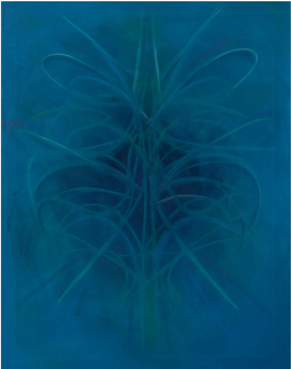
Sun – in an opposite spectrum, kombinovaná technika, 80x60, 2023