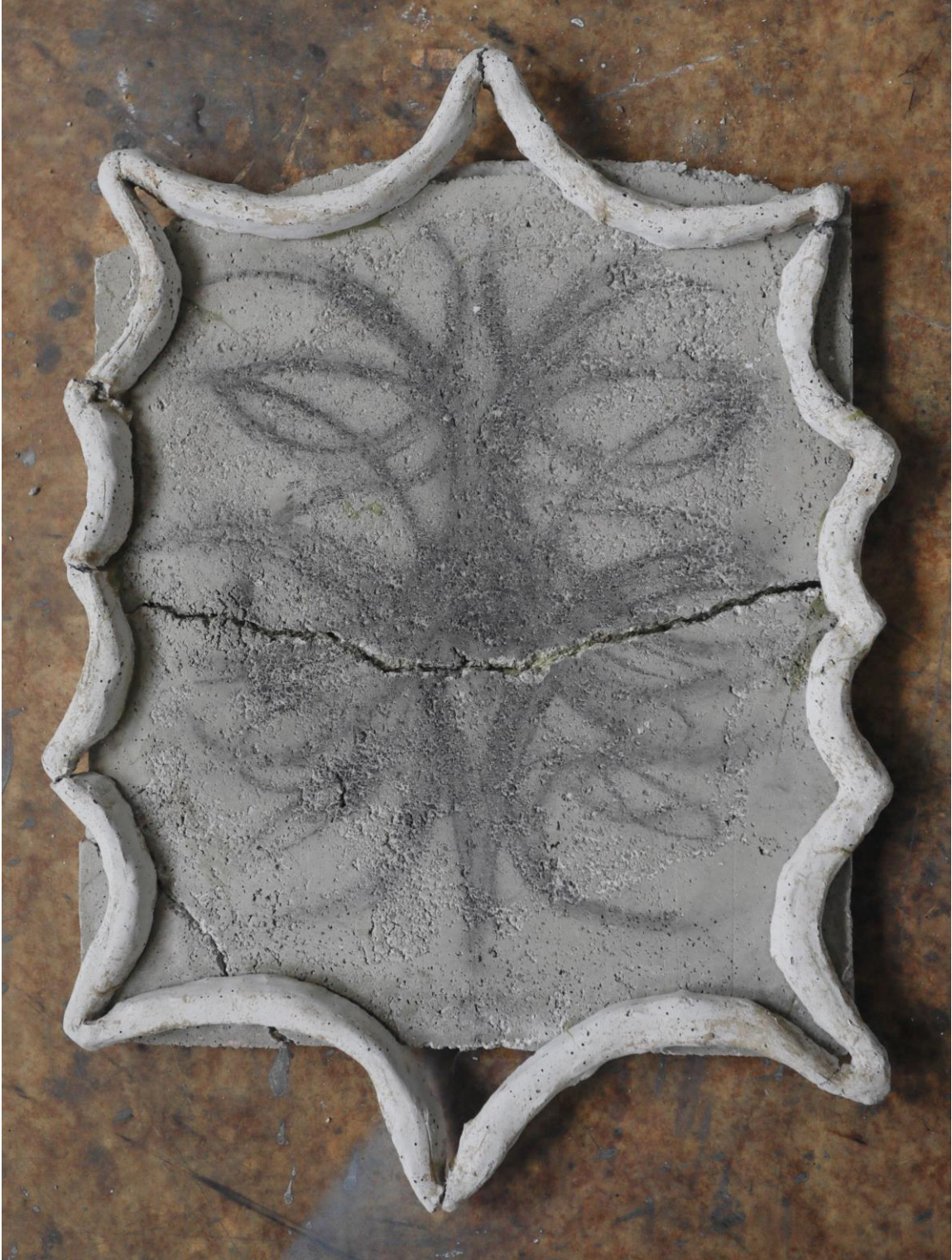
Sun – the hard part, betón, uhol, 50x40, 2023