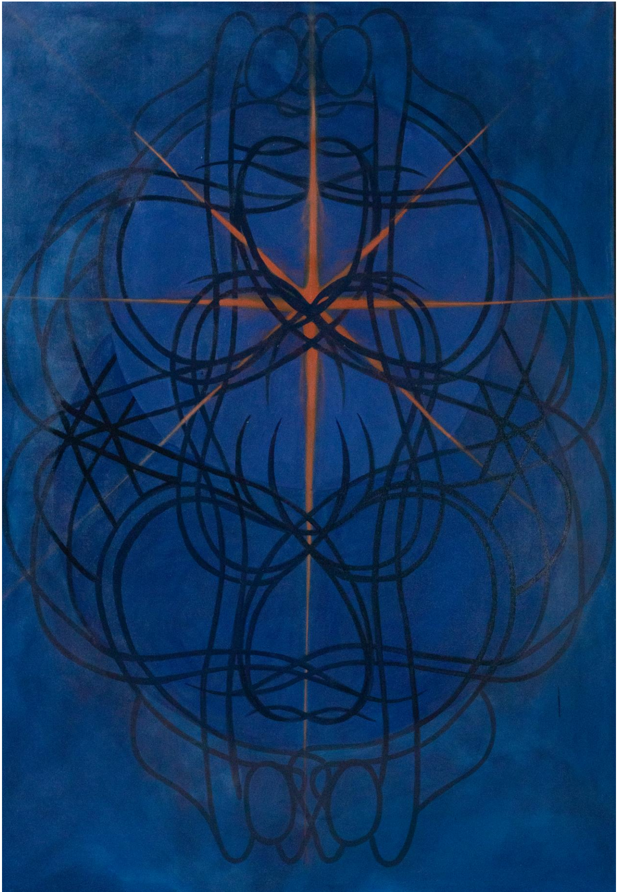
Sun – the dependence on the glow, kombinovaná technika, 200x140,2023