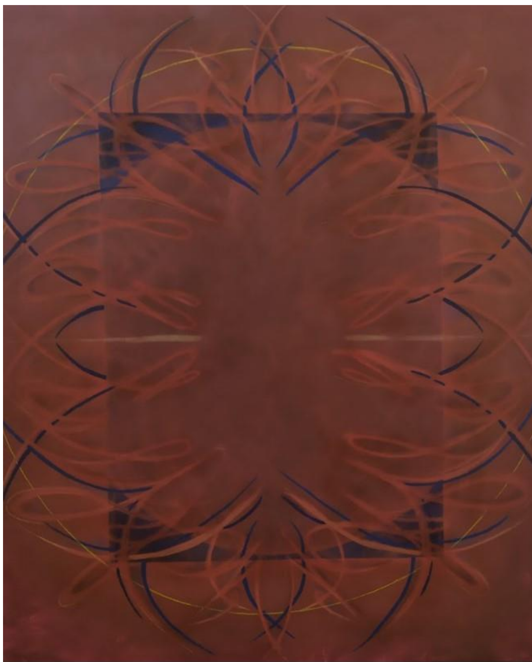
Sun – the horns, kombinovaná technika, 100x80, 2023