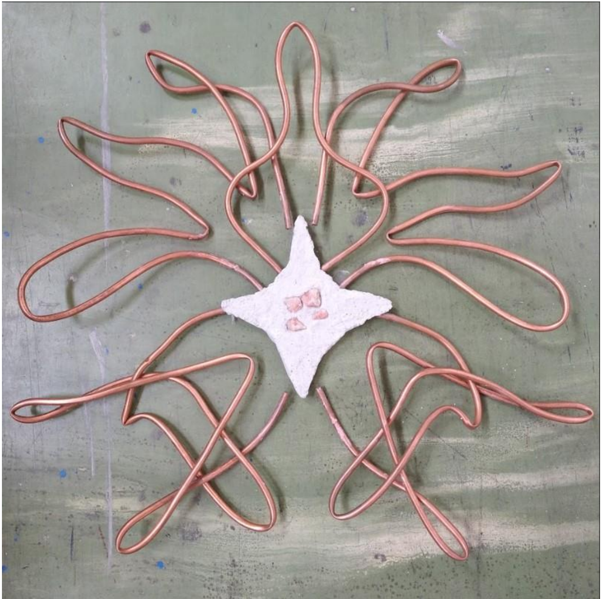
Sun – the everlasting rays, objekt z medi a betónu, 50x50, 2023