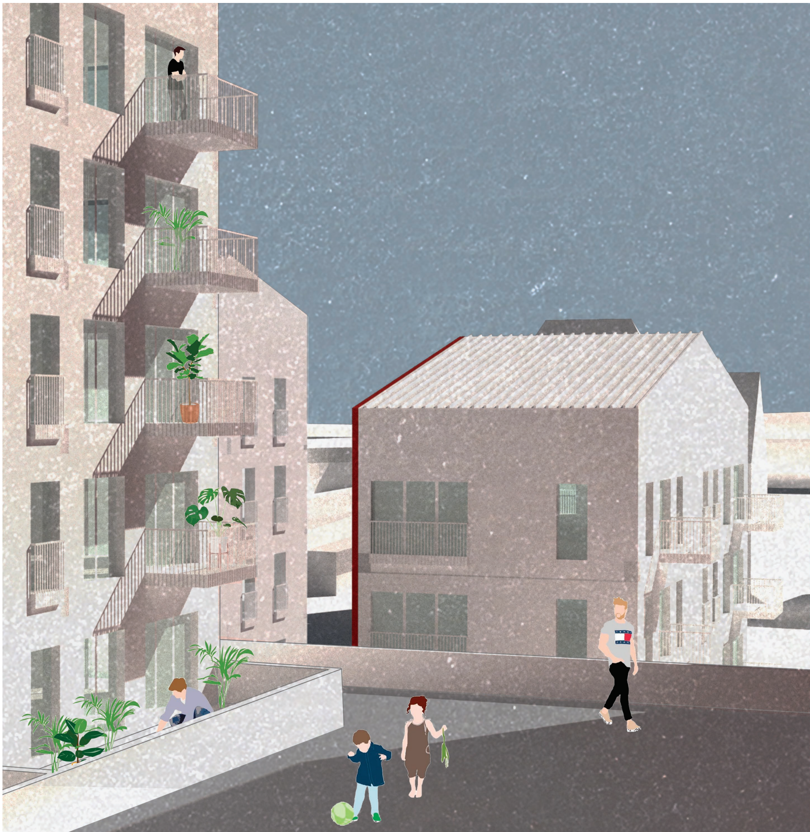
↑ POHLED ZÁPADNÍ - MEZIPROSTOR BYTOVÝCH DOMŮ