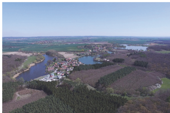
Obrázek 2 – Bilek, Komorní a Vražda u Nouzova

polovině 18. století, v minulosti mohl být větší a jeho objetí na koni trvalo jezdcí celý den), byl vystavěn již koncem 15. století [14, s. 160] [15, s. 190]. Také Poděbradsko, silně zaplavované a podmáčené vodami Labe, Cidliny a Mrliny, patřilo mezi málo úrodné, bažinaté kraje. Na přelomu 15. a 16. století zde vznikl systém asi 200 rybníků, napojený na Cidlinu, Mrlinu a kanály Sánský a Nový. Sánský kanál (Lánská strouha) přiváděl vodu do rybníka Blato o rozloze 996 ha (původně snad ještě více), vysoušeného od roku 1764. Náš historicky největší rybník (původně asi o třetinu větší než rybník Rožmberk) byl unikátním vodohospodářským dílem, jedním z nejvýznamnějších svého druhu v Čechách [14, s. 160] [15, s. 190] [16, s. 164–167] [17]. Poděbradská rybníční soustava, oproti jiným historickým soustavám, zanikla zcela. Ačkoli však všechny rybníky soustavy byly vypuštěny a jejich plochy přeměněny v pole a louky, hráze či jejich pozůstatky v této výrazně suché a bezlesé krajině z velké části dodnes přetrvávají [13, s. 243–247].