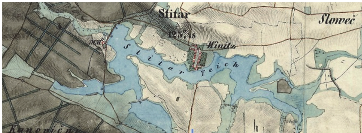
Obrázek 7 – Zaniklý Štítarský rybník s výraznou (dodnes zachovanou) hrází na mapě II. vojenského mapování

vybraných sídel projevila značná odchylka [22, s. 22]. Interpretaci znesnadňuje i fakt, že se nedochovala jednotná legenda. Každá sekce mapy je tudíž originál, a to nejen ve smyslu výtvarném a řemeslném, ale i ve smyslu kartografické symboliky [26, s. 168].