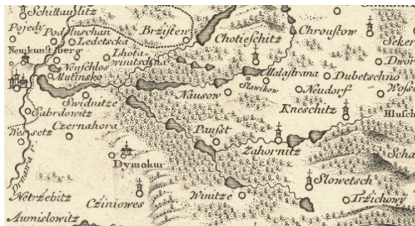
Obrázek 6 - Dymokursko na Müllerově mapě