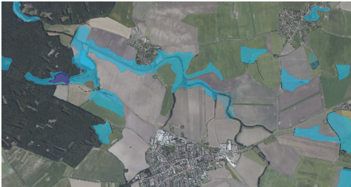
Obrázek 9 – Výřez mapy se zaniklými rybníky

Výsledky analýz dokazují, že i na první pohled běžná a nezajímavá zemědělská polní krajina vykazuje množství historických krajinných struktur, navíc s historicky ověřeným potenciálem pro zadržení vody v krajině [13, s. 242]. Na druhou stranu je problematika vodohospodářské bilance nad rámec tohoto textu. Rybník povrchovou vodu často spíše spotřebovává a nelze od něj očekávat nějakou výraznou dotaci průtoku bez újmy na jeho jiných funkcích. Rybníky nejsou v době sucha „automatem na vodu“, ale spíše adaptačním opatřením, opěrným bodem v krajině, a to jak pro všechno živé, tak i pro člověka [12, s. 30].