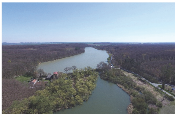
Obrázek 3 – Jakubský rybník s hrází

zanikla a nikdy nebyla obnovena. Z válečných hrůz se lidé, krajina a hospodářství vzpamatovávali dlouho. Po třicetileté válce a zejména v 18. a 19. století rybníky i nadále zanikaly, buď přirozenou cestou, nebo byly záměrně vysušeny a přeměňovány na zemědělskou půdu. Prioritou již nebyl chov ryb, ale pěstování obilí, posléze cukrové řepy a chov dobytka (produkce sena). Zrušení nevolnictví přineslo hlad po další orné půdě. Půda rybníčních pánví slibovala rychlejší a jistější výnosy. Plochy vysušených rybníků mohly sloužit coby pole, louky a pastviny a proto se rušily, zejména v úrodném Polabí, i zbylé vodní plochy. Důvodem však byla i nízká prestiž rybníkářství (dobové trendy a náhledy), které přestávalo mít pověst výnosného podnikání. Vliv ovšem mohly mít i výkyvy počasí vedoucí k negativní vodní bilanci (několik teplých a suchých period, mrazivé zimy vedoucí k promrzání rybníků, velké povodně) [12, s. 29-30]. Za necelých 50 let, do roku 1840, byla v českých zemích zrušena polovina rybníční plochy, v Polabí ještě více.