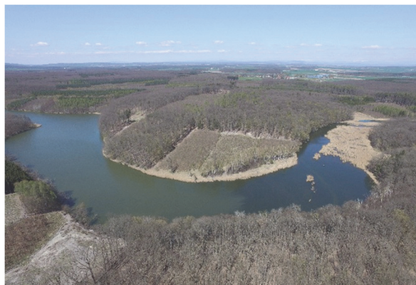
Obrázek 1 – Komárovský rybník

Správní obvod ORP Poděbrady je reprezentativním územím starosídelní krajiny Středolabské tabule s intenzivním zemědělským využíváním. Její struktura nese silné stopy hospodaření 19. století s rušením rybníků, regionální specializací zemědělské výroby a historických průmyslových staveb. Ačkoli je v některých částech zdejší krajina silně pozměněna velkovýrobním socialistickým hospodařením, fragmentárně v ní zůstaly stopy historické krajinné struktury vč. významných stop starší kultivace krajiny (rybníční soustavy, hradiště). Dle uvedené metodiky bylo v území vedle lokalit s přítomností typologicky různorodých znaků identifikováno šest celků a deset typologických jednotek historické kulturní krajiny,