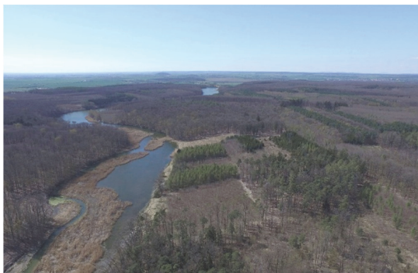
Obrázek 5 - Komárovský rybník

19. století. Soustava Dymokurských rybníků využívala na rozdíl od sousední nížinné oblasti Poděbradska převážně přirozených vodních toků, tekoucích v mělkých údolích zahloubených do křídové tabule (potoky Stříble, Štítarský, Záhornický a Smíchovský s přítoky). Díky tomu měly větší rybníky charakteristický protáhlý tvar a krátké hráze. Největší vodní plochou byl rybník Nepokoj severozápadně od Dymokuru (170 ha, vypuštěn až v 19. století, dochovala se hráz) a rybník Štítarský severozápadně od Městce Králové (asi 88 ha, vypuštěn 1864, dochovala se hráz). Potenciál vodní energie využívalo několik mlýnů, dodnes se dochoval velmi hodnotný mlýn Jakubský u Dymokuru a mlýn Bučický u Rožďalovic. Velmi hodnotný roubený mlýn Komárovský zanikl [19].