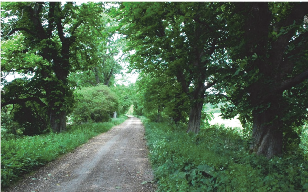
Obrázek 4 – Hráz zaniklého Štítarského rybníka

Dymokursko představuje tradiční krajinu rybníků, která je v současné době částečně reliktní. Historický obraz rybníční krajiny zde přetrvál jen v lesních komplexech, zatímco v polní zemědělské části krajiny byly rybníky až na výjimky zrušeny, ale jejich hráze často přetrvaly (nejmohutnější v případě Štítarského rybníka severně od Městce Králové). Mírně zvlněnou krajinou mezi Dětenicemi, Rožďalovicemi, Dymokury a Městcem Králové se totiž táhne průměrně 3 km široký a 18 km dlouhý pás lesa, který napříč protíná několik mělkých údolí potoků. Na všech těchto tocích se dochovaly středně velké a několik malých rybníků. Jejich stav se poměrně shoduje se situací na I. vojenském mapování, které zachycuje v lesních partiích ještě dva další větší rybníky, které