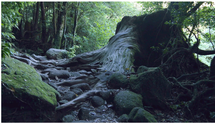
Marek Delong, video, nalezený materiál, 2015