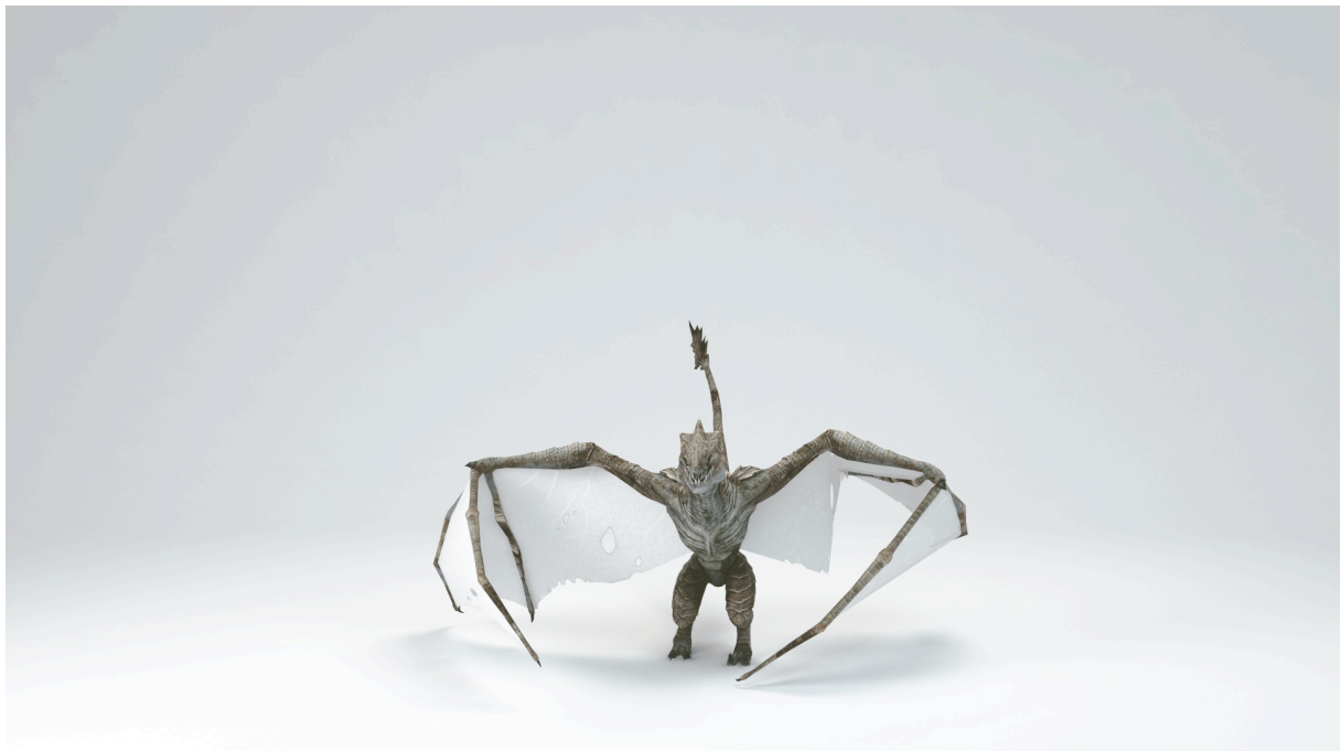
Marek Delong, 3d kompozice, 2015

K obhajobě bylo předloženo 5 obrazů (3x 3d objekt, 2x snímek z videa).