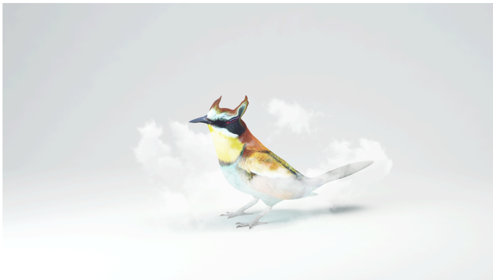
Marek Delong, 3d, postprodukce, 2015