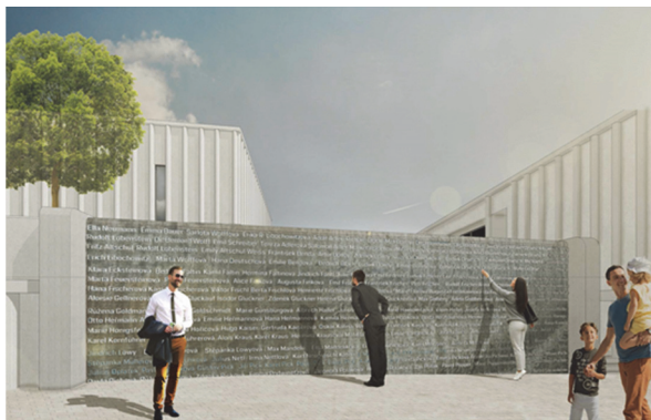
Obrázek 6 – Nová synagoga, Marco Aulisa, kašna (archiv autora [4])