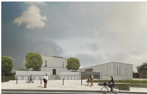
Obrázek 5 – Nová synagoga, Marco Aulisa (archiv autora [4])

Jména jednotlivých obětí jsou vyfrézovaná do kamene tak, aby vystupovala do popředí. Minimální přešlap u hladiny vody vytvoří na těchto stěnách pomalu stékající vodu, takže po kapkách a tyto kapky padají přes jednotlivá jména židovských obětí. Výsledek zobrazuje silný dojem a celkově tíhu na historické události, které se podepsali na židovskou komunitu v České Lípě. A nejen v České Lípě. Interiér modlitebny se světlíkem a památník jsou orientovány striktně na východ.