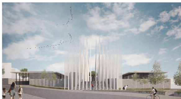
Obrázek 1 – Nová synagoga, Filip Knichal (archiv autora [4])

hlavní vstupy včetně schodištěm doplněného o dvojici kašen, které je zároveň součástí památníku. V objektu a jeho okolí jsou záměrně vytvořena zákoutí doplněná o zeleň, která zprostředkovávají různé atmosféry a přidávají exteriérovému prostoru na atraktivitě pro uživatele i jeho okolí. Exteriér objektu působí důstojně a sebevědomě díky zvolenému materiálu velkoformátového obkladu v jasných liniích v kombinaci skleněných ploch a subtilních sloupů. Interiér je založen na otevřenosti, světlosti a jednoduchosti. V návrhu je kladen vysoký důraz na propojení interiéru s exteriérem pomocí průhledů a vstupů na nádvoří a terasy. Světlo je do převyšěného modlitebního prostoru primárně přiváděno okny bazilikálního osvětlení a bočními skleněnými plochami s výhledy do exteriéru na vodní hladinu. Sekundární světlo představují odrazy od vodní hladiny, jako symbol Božího světla stvoření. Význam světla se v modlitebním prostoru projevuje i v navrženém architektonickém detailu čtecího pultu Thóry se symbolem menory, tedy sedmiramenného svícnu. Menora v hebrejštině znamená světlo, kterého je zároveň nositelem. Vede každého k nalezení Hospodina po cestě ozářené světlem chrámového svícnu. A jak pravil Prorok Izajáš: „Nuže, dome Jákobův, choďme v Hospodinově světle!“