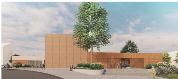
Obrázek 2 – Nová synagoga, Andrea Marečková (archiv autora [4])

o spojnici pohledových os z křižovatky ulic Moskevská a U Synagogy a křižovatky ulic Erbenova a Berkova, kde přibližně v těchto místech stála i původní synagoga. K synagoze přiléhá nízká budova vytvářející uzavřené atrium. To má sloužit pro zklidnění věřících před modlitbou. Další dva objekty propojené podzemním podlažím utváří spolu se synagogou a jejím zázemím kontrolovatelný vnitroblok. Všechny objekty pak fungují jako jeden celek s možností propojení a využití více funkcí. Budova administrativy a komunitního centra má sloužit jako bariéra, chránící vnitroblok i synagogu před nežádoucími vlivy rušné silnice.