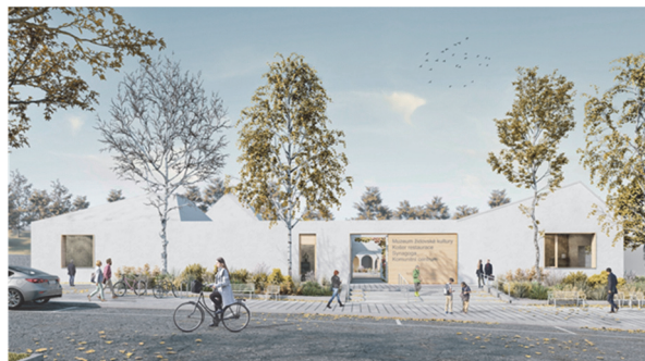
Obrázek 4 – Nová synagoga, Jakub Prachař, hlavní vstup

Výraz objektu má vyjadřovat čistotu a jednoduchost – proto byly navrženy světlé odstíny materiálů. Povrchy jsou opatřeny bílou omítkou a betonové plochy jsou navrženy pohledovým betonem bílé barvy doplněné o prvky z mosazi.