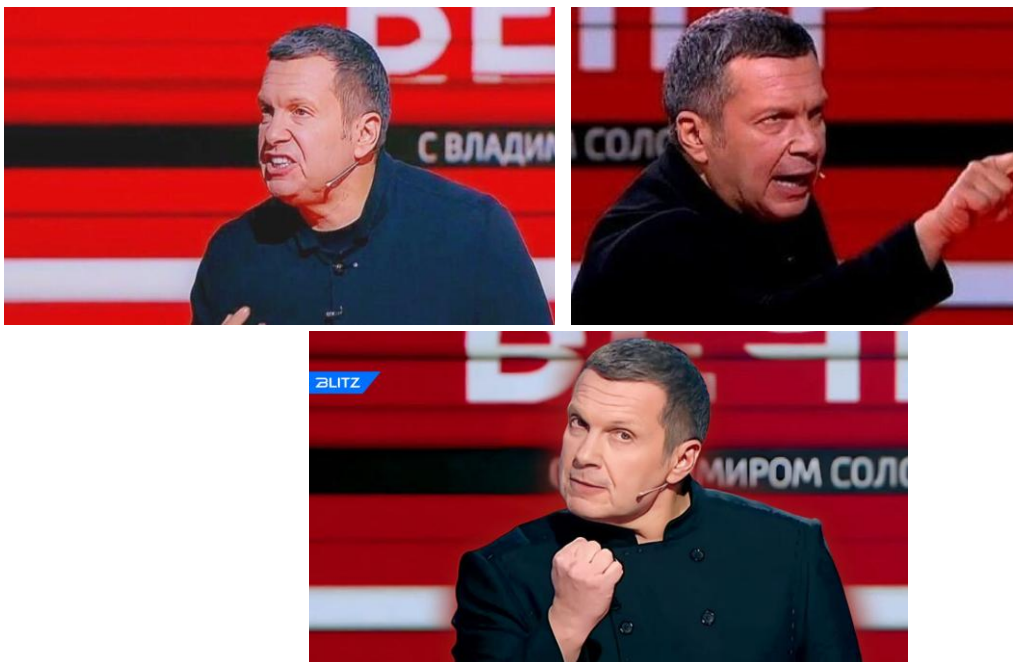
Záběry z politického pořadu "Večer s Vladimirom Solovyovym", moderátor Vladimir Solovyov

V podstatě je tato metodická příručka dobře propracovaným scénářem pro televizní moderátory, kteří podle něj musí „zahrát roli“ s využitím expresivních vyjadřovacích prostředků a mimiky.