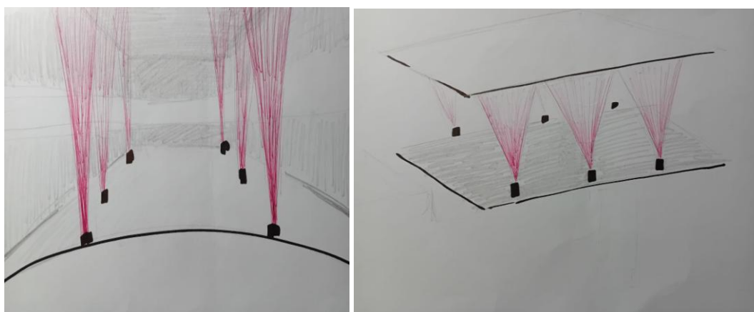
Propaganda agresorů (skicy), reflektor Source Four LED Series 2 (6 ks), multikanálové reproduktory (11 ks), přibližné rozměry: 16 x 19 x 6 m, 2023 (13. 5. – 16. 5. 2023, Výstaviště 405/1, 603 00 Brno)