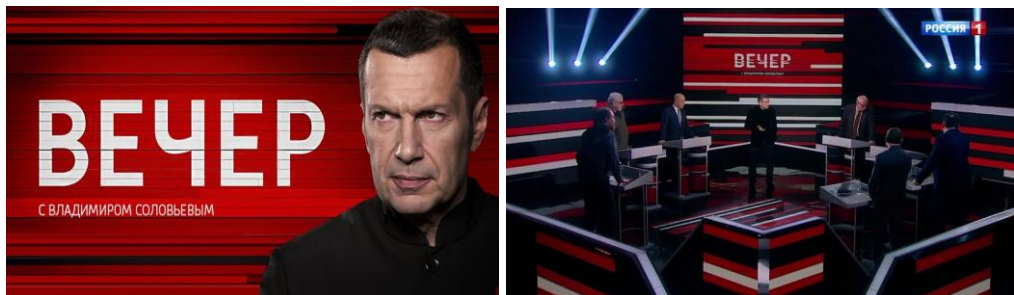
Úvodní obrazovka a televizní studio pořadu „Večer s Vladimírem Solovjovym“

Stejný princip používají kremlevští propagandisté. Natáčejí politické pořady ve studiu, kde ve většině případů září paprsky červeného světla, které zároveň zdůrazňují agresivním zabarvením projevů. Ve výsledku si pravidelní diváci vytvořili asociaci červené barvy s nejslavnějším moderátorem Vladimírem Solovjovym z politického pořadu „Večer s Vladimírem Solovjovym“. Na základě výše uvedené informace jsem tedy zvolila červené světlo jako umělecký prostředek pro vytvoření mé instalace.