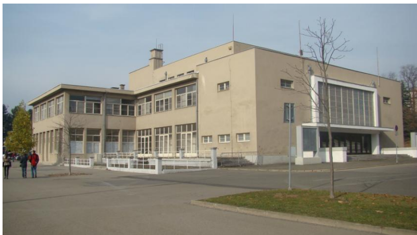
Divadlo na Výstavišti od Emila Králíka, Výstaviště 405/1, 603 00 Brno Dostupné z: https://www.theatre-architecture.eu/cs/db/?theatreId=948