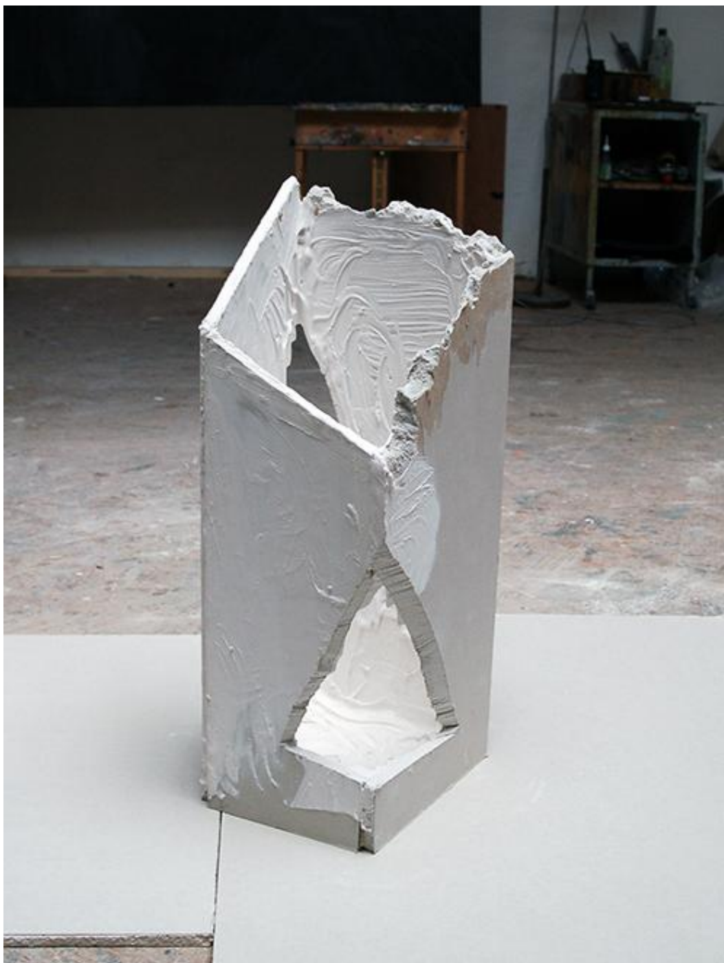
Bez názvu, sádrokarton, sádra, 65 cm x 28 cm x 20cm, 2014