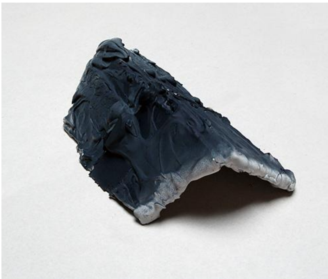
Bez názvu, sádra, 42 cm x 26 cm x 15 cm, 2014