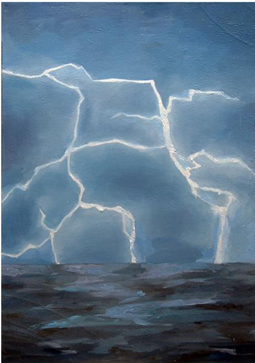
Blesk , olej na plátně, 90cm x 63 cm, 2014