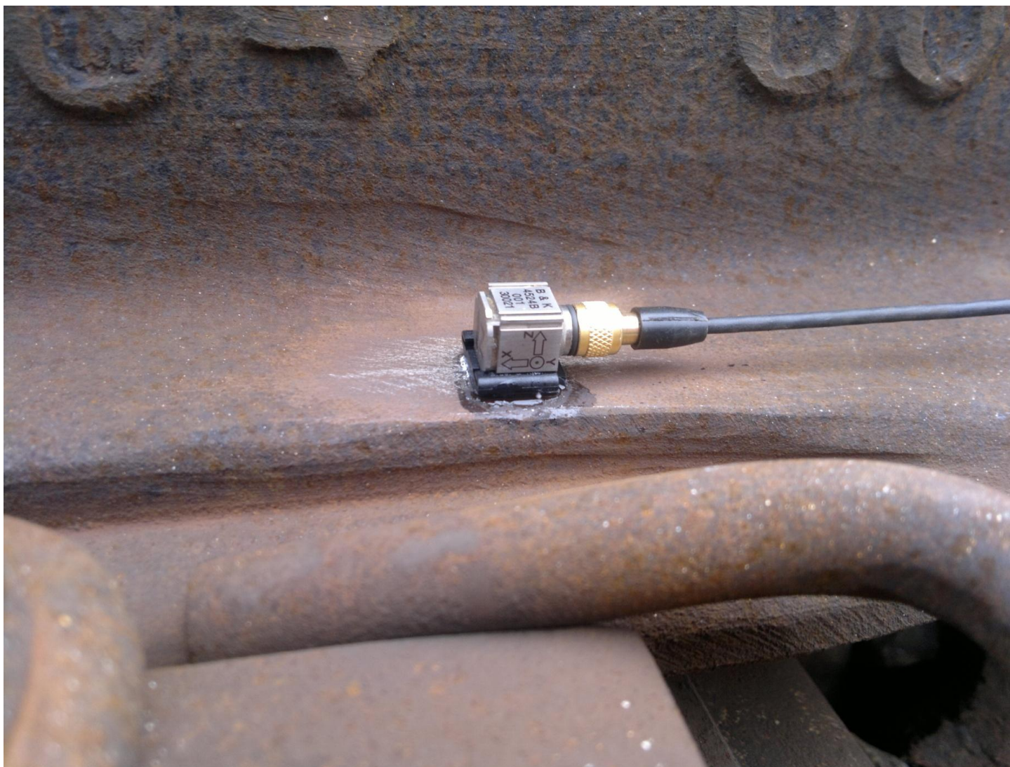
Upevnění tříosého akcelerometru na patě křídlové kolejnice