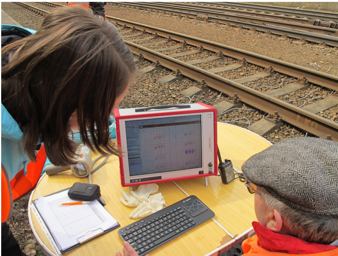
Kontrola naměřených dat hned po měření – vyhodnocovací jednotka Dewetron