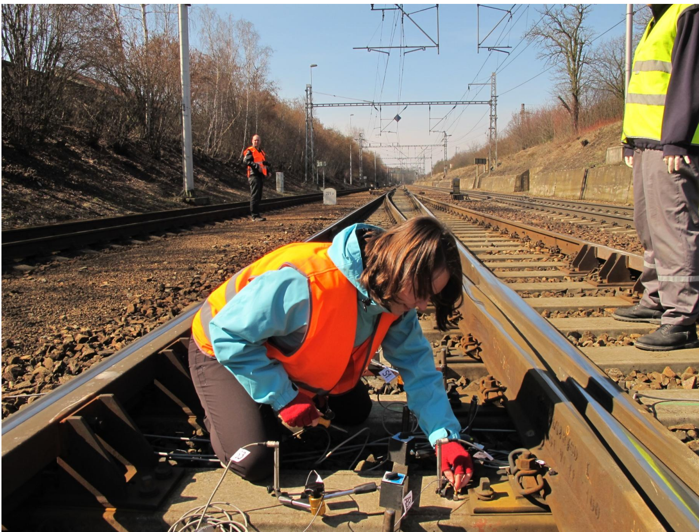
Kalibrace indukčních snímačů posunů pomocí Johannsonových destiček