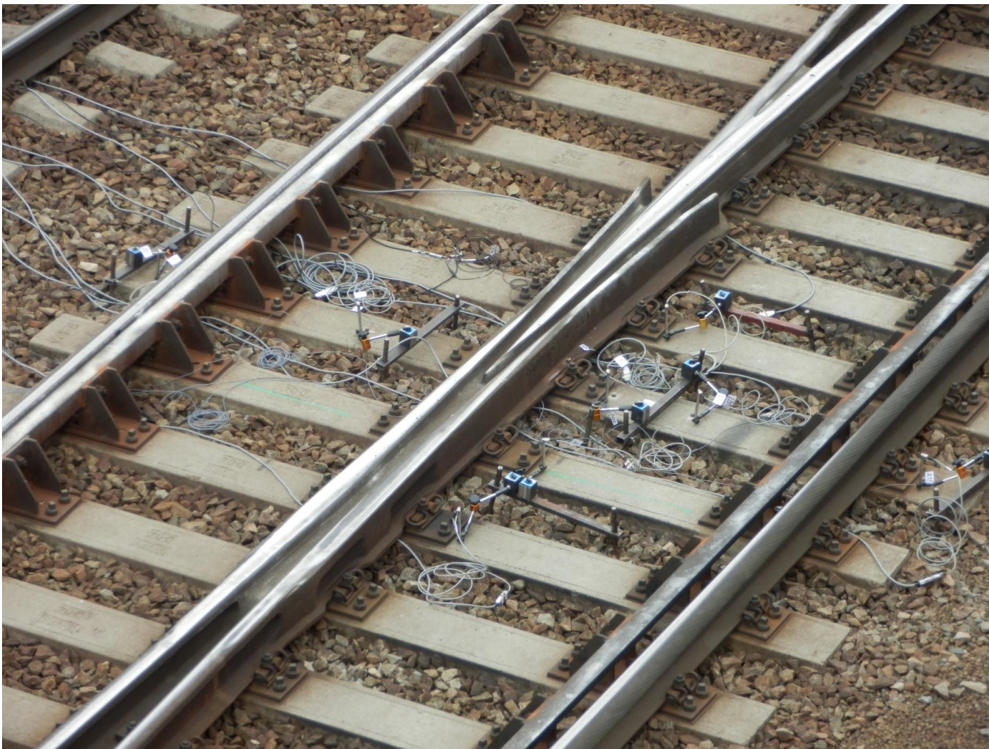
Výhybka č. 59 s nainstalovanými snímači