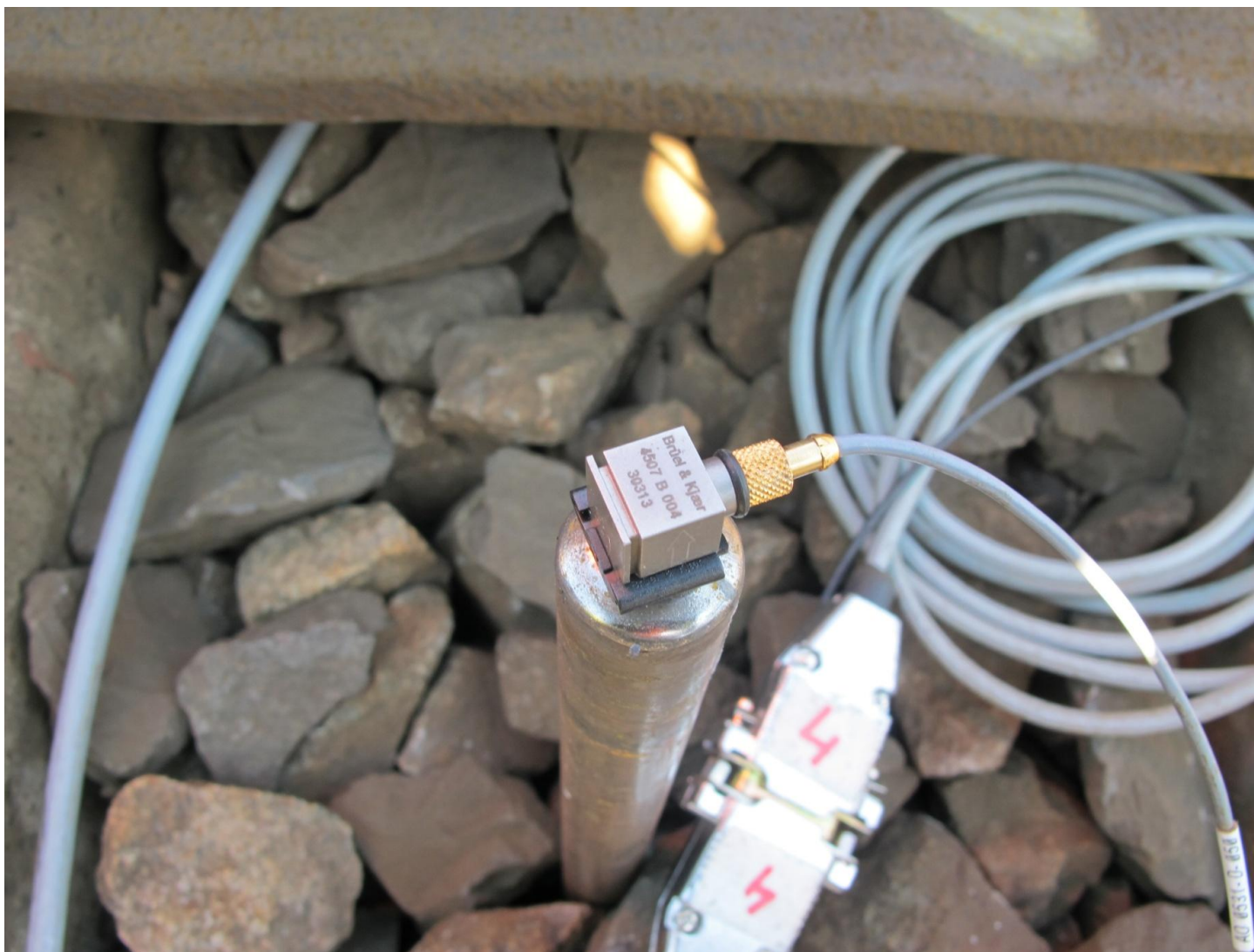
Detail upevnění snímače zrychlení vibrací na měřící tyč zatlučenou do štěrkového lože