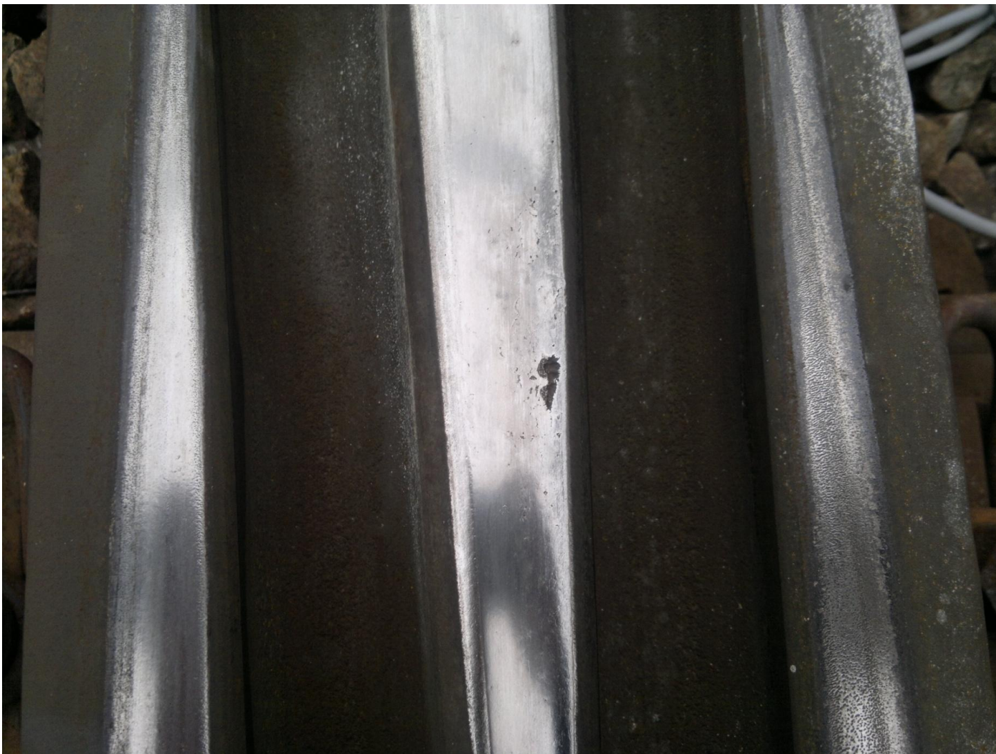
Kontaktně únavová vada na hrotu srdcovky výhybky č. 59