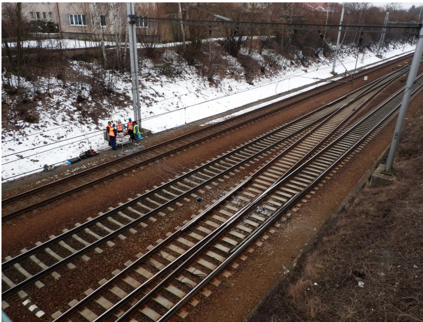
Pohled na měřené konstrukce