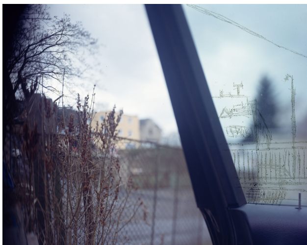
název: Změna účelu vozidla materiál/technologie: fotografie výška x šířka v cm: 50 x 60 cm rok vzniku: 2010