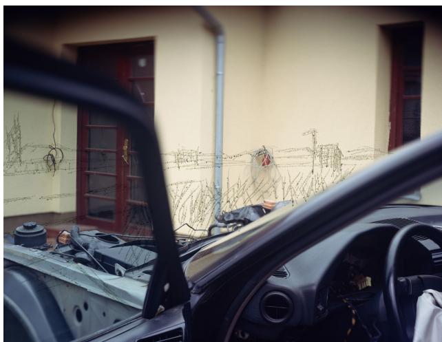
název: Změna účelu vozidla materiál/technologie: fotografie výška x šířka v cm: 50 x 60 cm rok vzniku: 2010