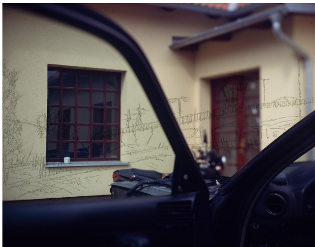
název: Změna účelu vozidla materiál/technologie: fotografie výška x šířka v cm: 50 x 60 cm rok vzniku: 2010