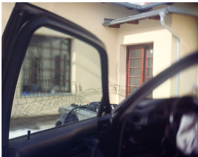
název: Změna účelu vozidla materiál/technologie: fotografie výška x šířka v cm: 50 x 60 cm rok vzniku: 2010