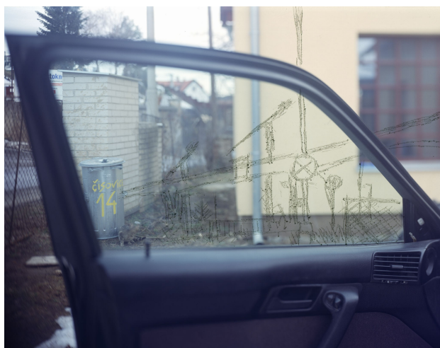
název: Změna účelu vozidla materiál/technologie: fotografie výška x šířka v cm: 50 x 60 cm rok vzniku: 2010