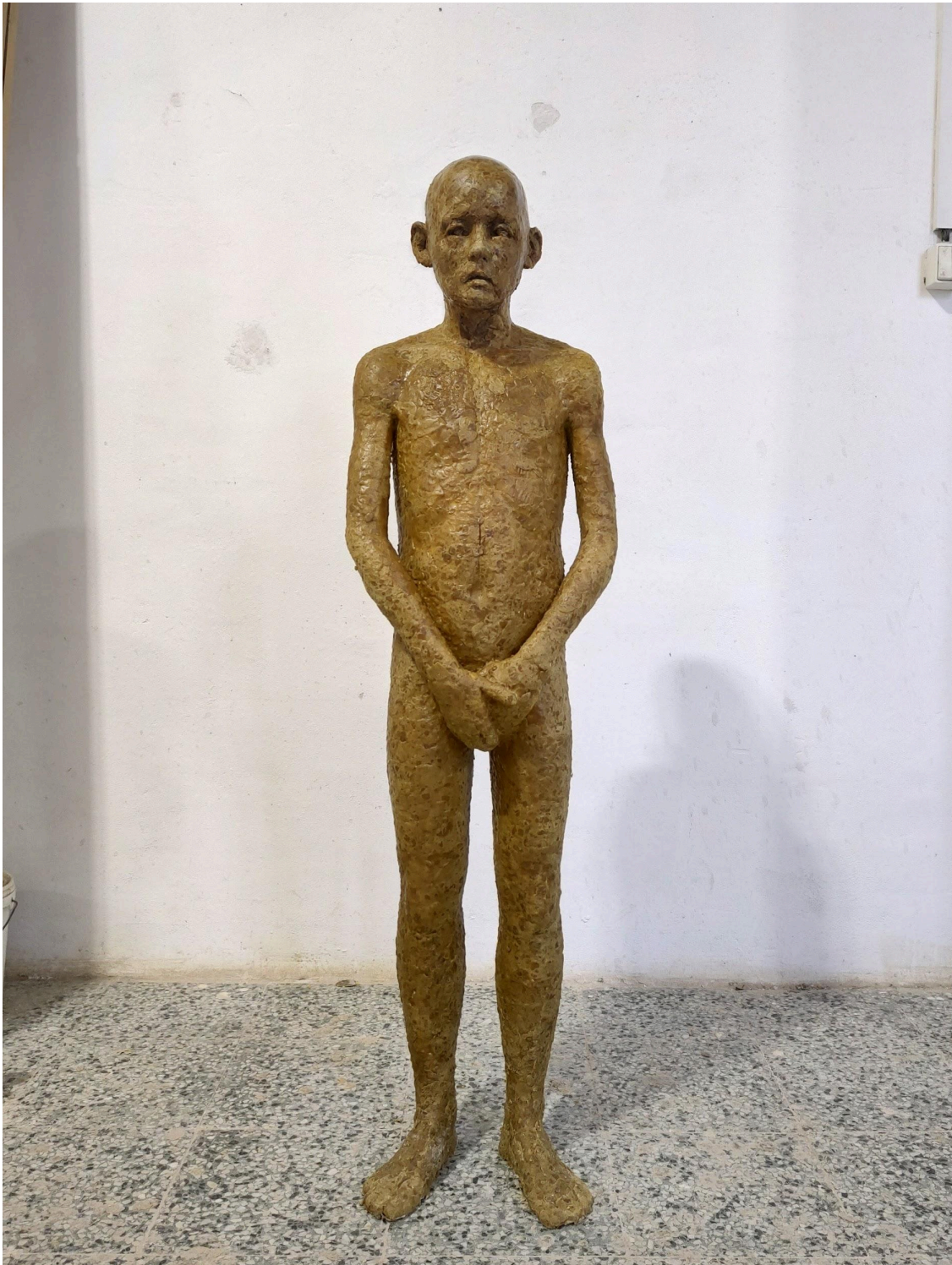
Crohnova nemoc, chlapecká postava do instalace. rozměry: 380 x 1430 x 215 mm. materiál: včelí vosk, sádra