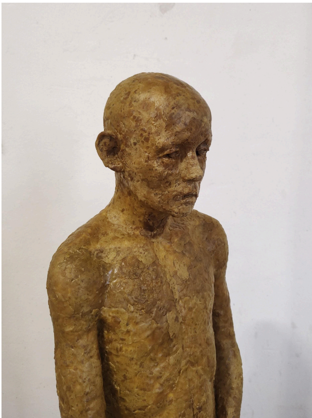
Crohnova nemoc, chlapecká postava do instalace. rozměry: 380 x 1430 x 215 mm. materiál: včelí vosk, sádra