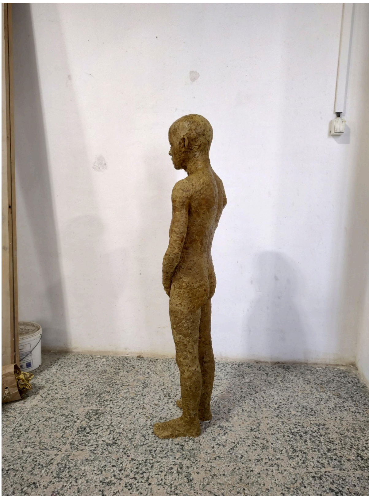
Crohnova nemoc, chlapecká postava do instalace. rozměry: 380 x 1430 x 215 mm. materiál: včelí vosk, sádra